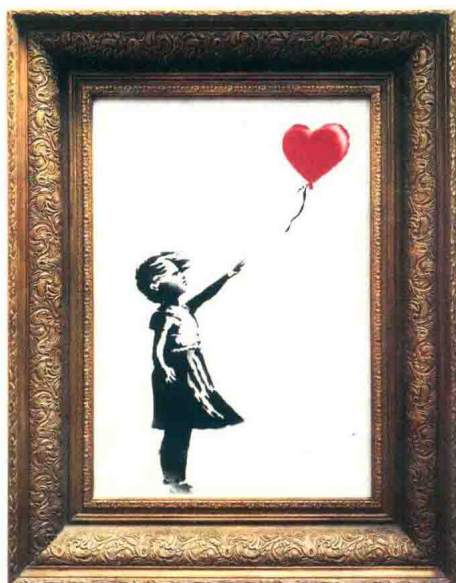
Banksy 《放气球的小女孩》2006，在2018伦敦苏富比以104万英镑售出