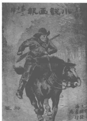
图 3.1 《狩猎》(1919年9月《小说画报》第21号封面,钱病鹤绘)