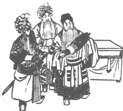
图 4 孟鸿茂之《七擒孟获》

钱病鹤所绘古装折子戏闻名一时，1929年世界书局版的《戏画大观》中所收戏画近百幅之多。(图4)