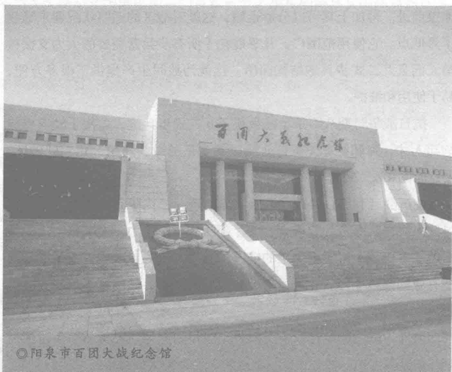
◎阳泉市百团大战纪念馆

方米，分上下两个展厅，展线长达 173 米，共展出照片 126 件，地图 4 件，图表 3 件，绘画 5 件，书法作品 10 件 14 幅。