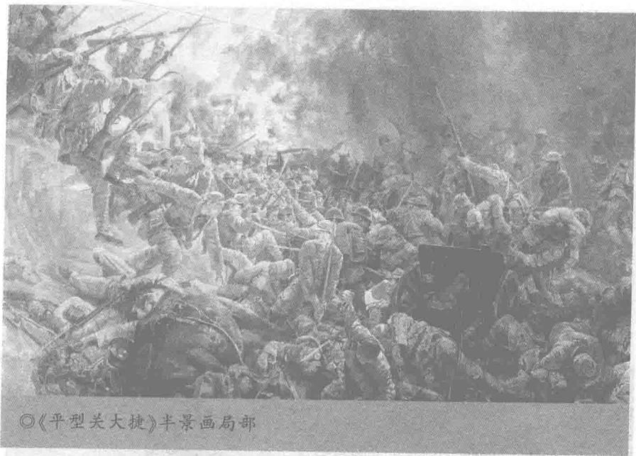
◎《平型关大捷》半景画局部

米，由半景油画、地面塑形、六台电脑和六台投影组成，通过声、光、电等高科技手段重现了当年平型关大捷战斗的整个过程。