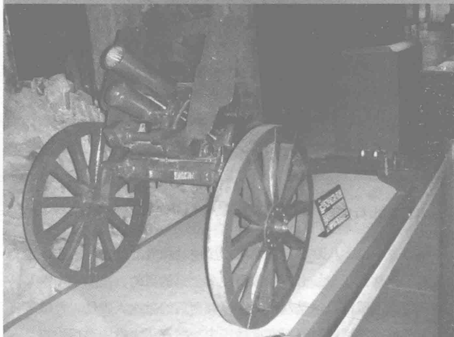
◎日军九二式步兵炮

除此之外，九二式步兵炮在运输上的要求很低，适合在复杂的地形上使用。在没有任何车辆的情况下，未经训练的畜力或人力都可以