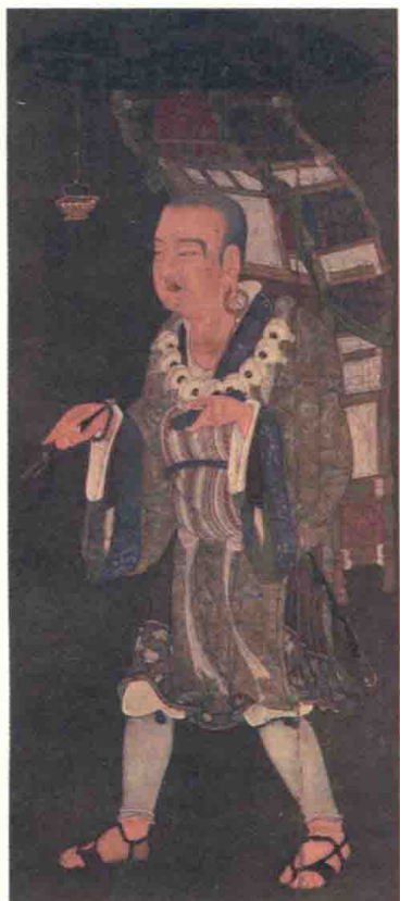
大唐三藏法師玄奘 (602—664)