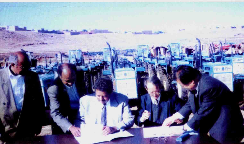
大使在援助交接仪式上签字