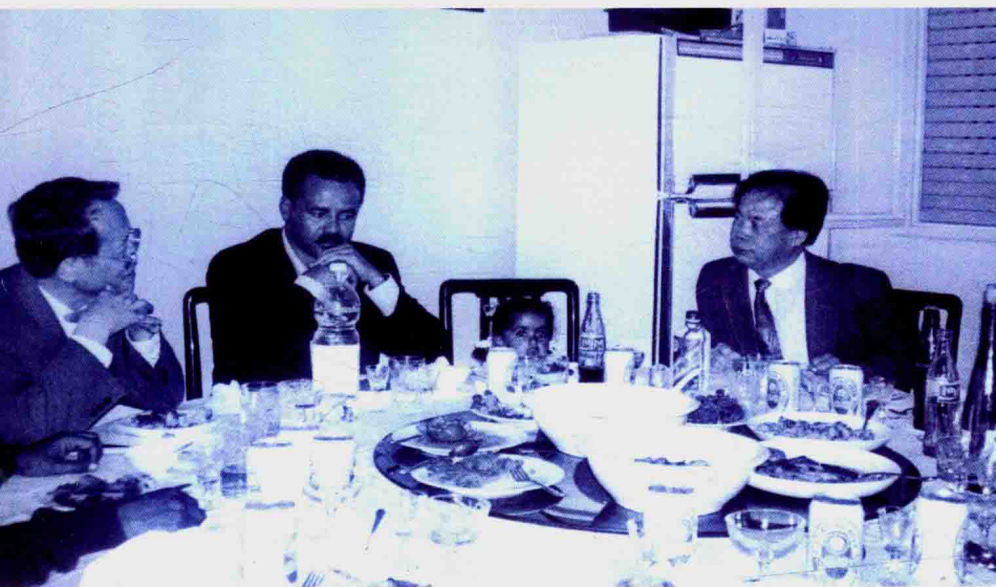
大使宴请厄立特里亚总统(右一作者)