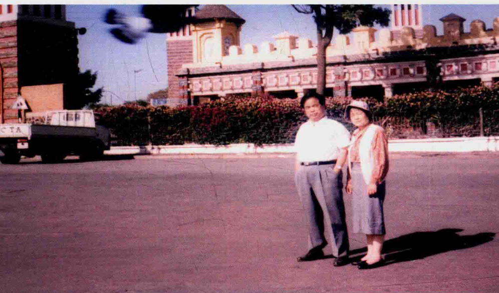
作者夫妇在厄立特里亚首都东正教教堂前留影