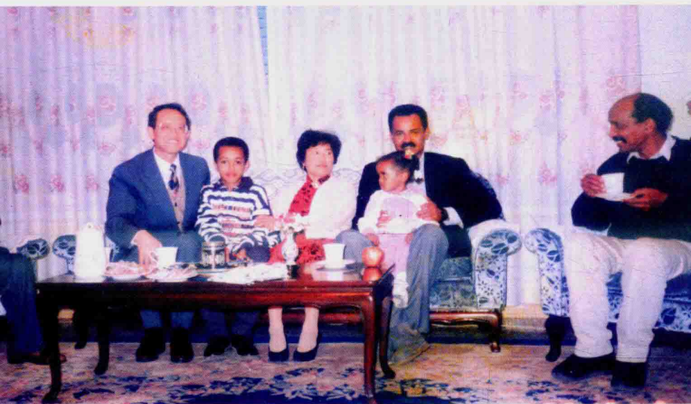
大使夫妇宴请厄立特里亚总统(右二抱小孩者,左一为作者)