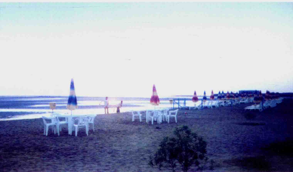
厄立特里亚红海之滨