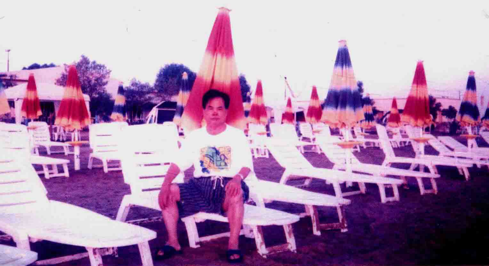
在厄立特里亚红海度假