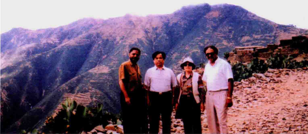
作者夫妇与当地商人在阿斯马拉郊区