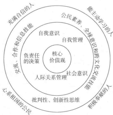
图1 新加坡“21世纪素养”框架

核心素养的提出，让我们的地理教育在素质教育的基础上重新审视我们的教育观：21世纪培养的学生应该具备哪些最核心的知识、能力与情感态度，才能成功地融入未来社会，才能在满足个人自我实现需要的同时推动社会发展？参照新加坡教育部2010年颁布的新加坡学生“21世纪素养”框架（见图1），一线地理教师应坚持以人为本，以发展学生“带得走”的能力发展为教育目的，以核心素养培育模式取代知识传授体系，通过正确的现代教育观实现学生真正的有效学习。