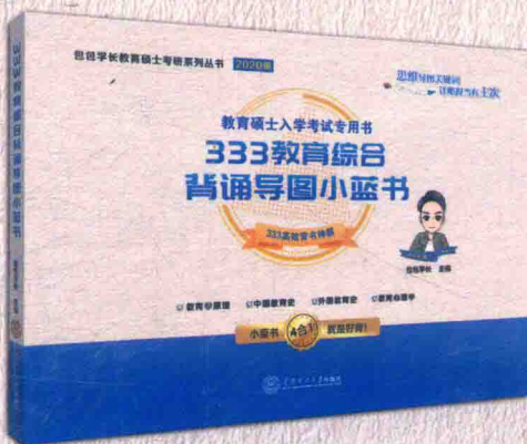
333教育综合背诵导图小蓝书