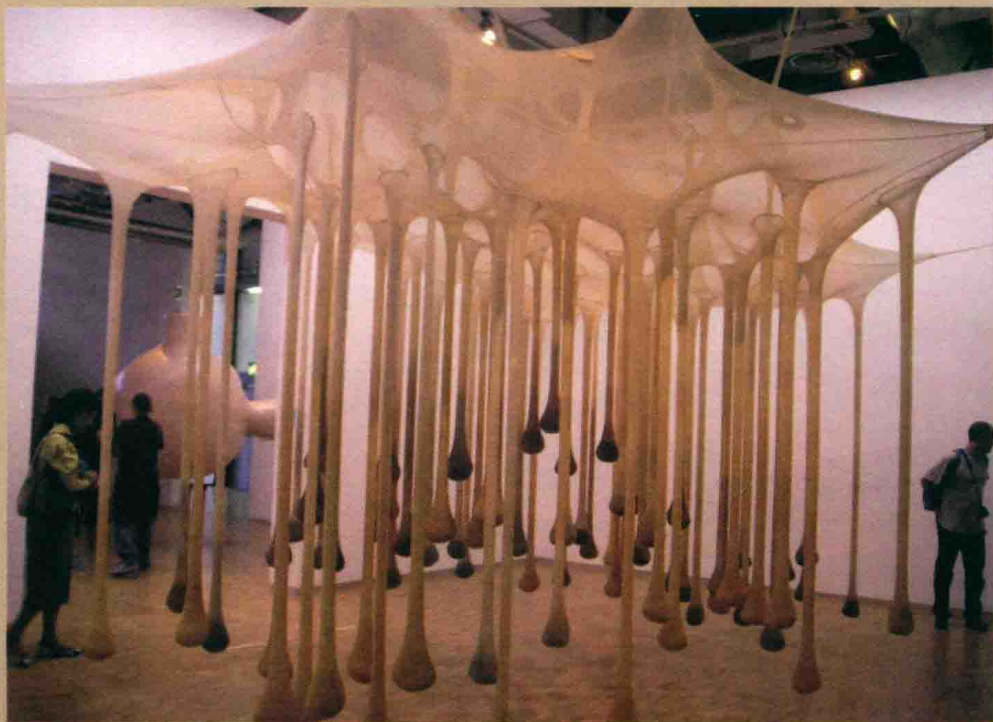
↑ 蓬皮杜现代美术馆内部一景

流派的作品，包括立体派、抽象派、超现实主义派、结构派、概念艺术及流行艺术等3万件。馆内按时间顺序陈列着各个流派艺术的代表作，周围分设许多小展室，分别介绍各流派及代表艺术家的作品。马蒂斯、毕加索、达利、康定斯基、沃霍尔……几乎所有现代艺术巨匠都不缺席。这里留下了艺术史上永远值得铭记的一笔：杜象的《泉》在此展出，揭开了现代艺术的序幕。