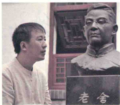
魏新，文化学者，全国青联常委，央视《百家讲坛》主讲人。