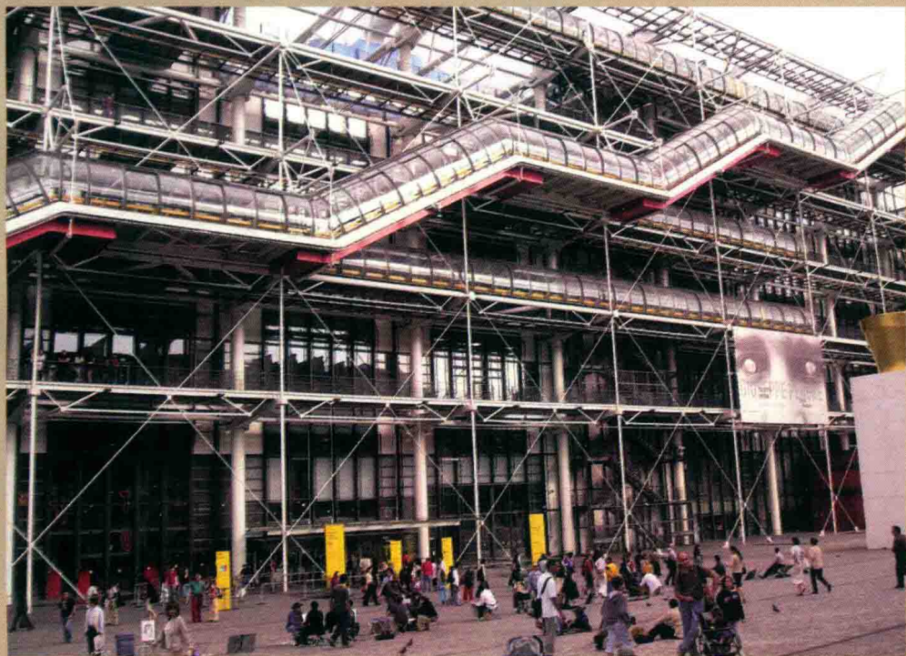
↑ 蓬皮杜现代美术馆外观

这座建筑因大胆前卫的设计，在初建之时遭到巴黎市民的严厉批评，认为它丑陋不堪。如今却成为法国最受欢迎的美术馆，每天涌进大批参观者。