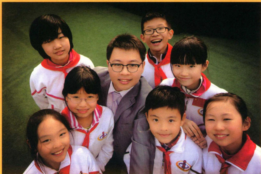
我与微社团的学生