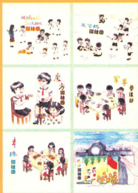
丰富多彩的微社团