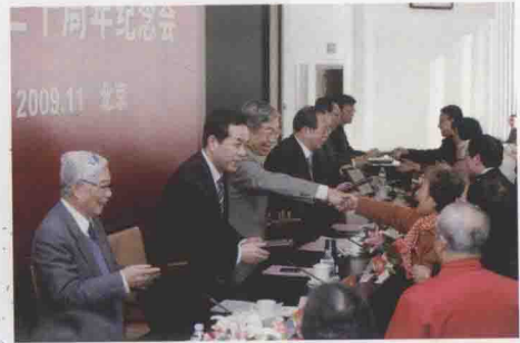
《李吉林文集》获中国教育学会科研成果 一等奖第一名，全国人大副委员长许嘉璐 为李吉林颁奖