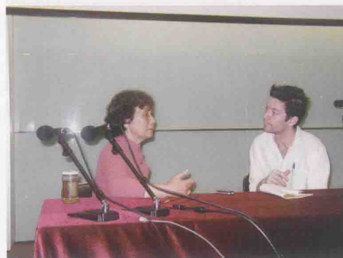
2007年李吉林在香港接受《南华早报》记者专访