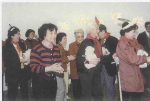
情境教育的魅力吸引了一群著名艺术家 (右起:秦怡、黄宗英、张瑞芳、赵青)