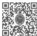
普通高等学校学生安全 教育及管理暂行规定