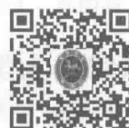
国家教育考试 违规处理办法