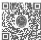
普通高等学校 学生管理规定