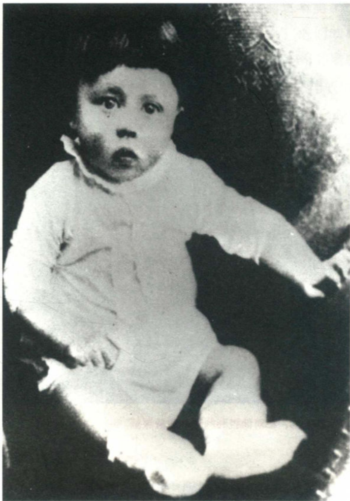
1岁左右的阿道夫·希特勒：他是后来失去了童真，还是生来就是恶人？

论：一个人的性格究竟是与生俱来的，还是后天养成的？作恶者是出于天性和某种生理冲动，才在反社会行为中寻求快感吗？又或者，是后天的成长环境造就了他们的这种行为模式？