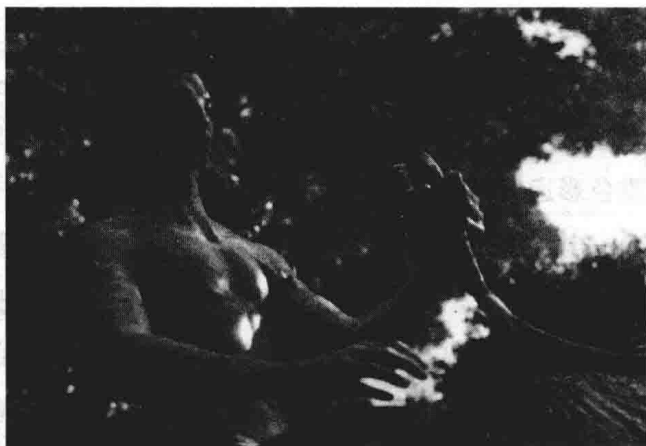
图 1-1 《阿凡达》

詹姆斯·卡梅隆执导的好莱坞科幻大片《阿凡达》Avatar(2010),投资5亿美元,票房27亿美元,是迄今为止世界上投资金额最高和票房收入最高的电影。《阿凡达》如此辉煌的票房业绩,固然有商业炒作的成分,有观众追风的原因,但是,技术因素无疑是《阿凡达》一片的重要卖点。《阿凡达》涉及多重电影新技术:立体视觉、IMAX大银幕、3D、CG等。立体视觉、大场面、高画质以及目眩神迷的电影特技吸引着片商和观众的眼球。通过各种宣传推介,观众得到的信息是,整部电影的制作过程中幕后有48家公司和