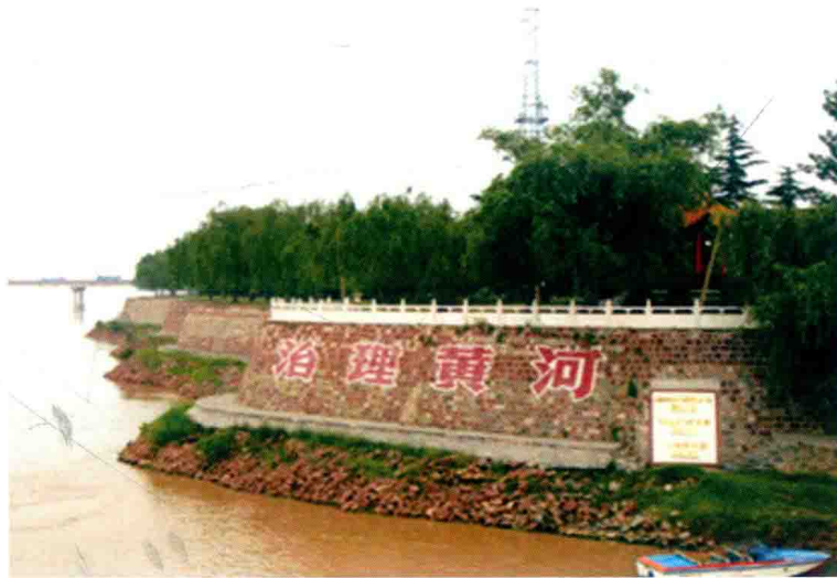
郑州黄河花园口险工 (2013年)