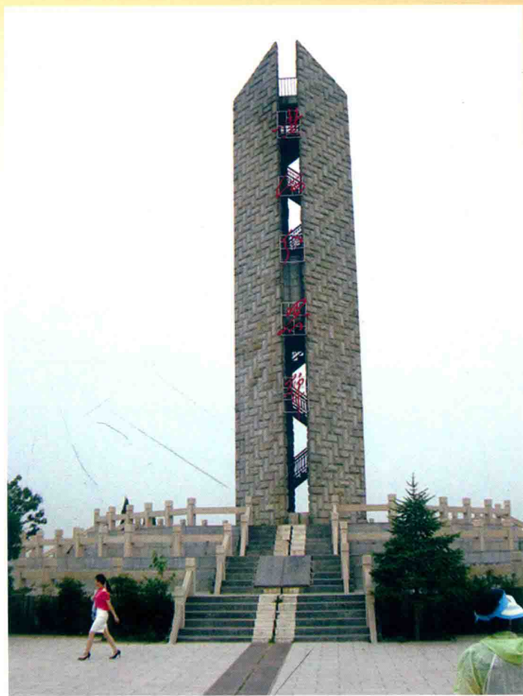
黄河中下游交界碑 —— 郑州黄河桃花峪 (2013年)