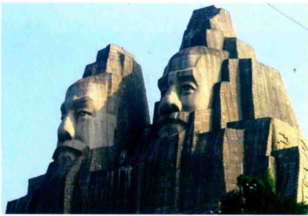
炎黄二帝大型雕塑 (2013年)