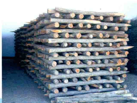
郑州黄河防汛木桩 (2012年)