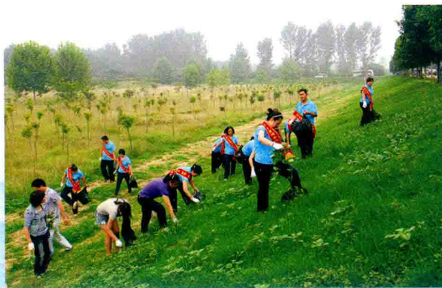
职工志愿队净化美化黄河 (2012年)