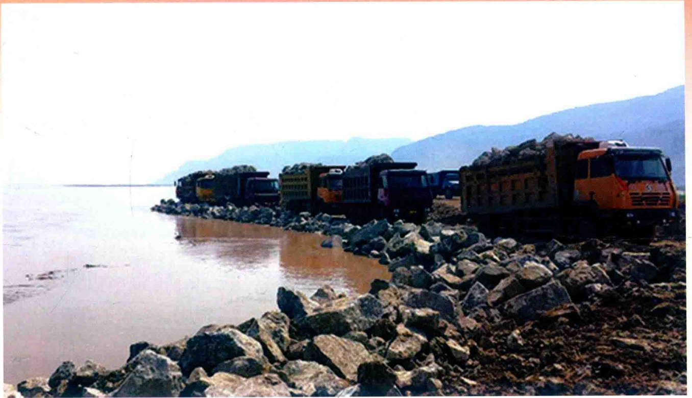
郑州黄河金沟控导工程块石进占施工 (2012年)