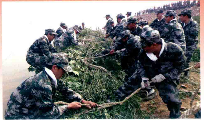
郑州黄河人工捆抛柳石枕 (2012年)