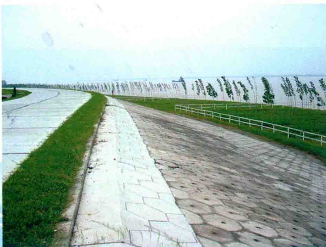
洪湖监利长江干堤加固工程 (2004年 郑州黄河工程公司承建)