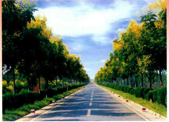
郑州黄河堤防秋色 (2013年)