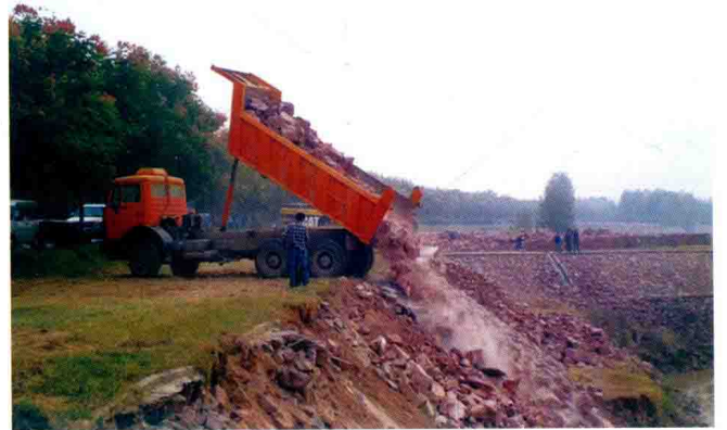
郑州黄河自卸汽车抛石 (2012年)