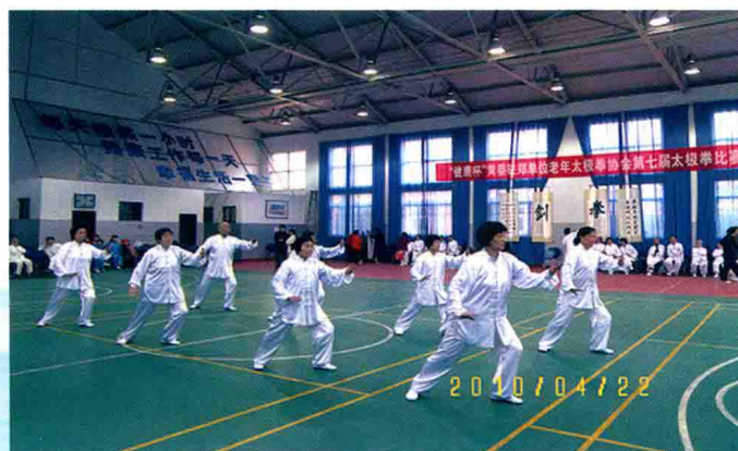
离退休职工太极拳比赛 (2010年)