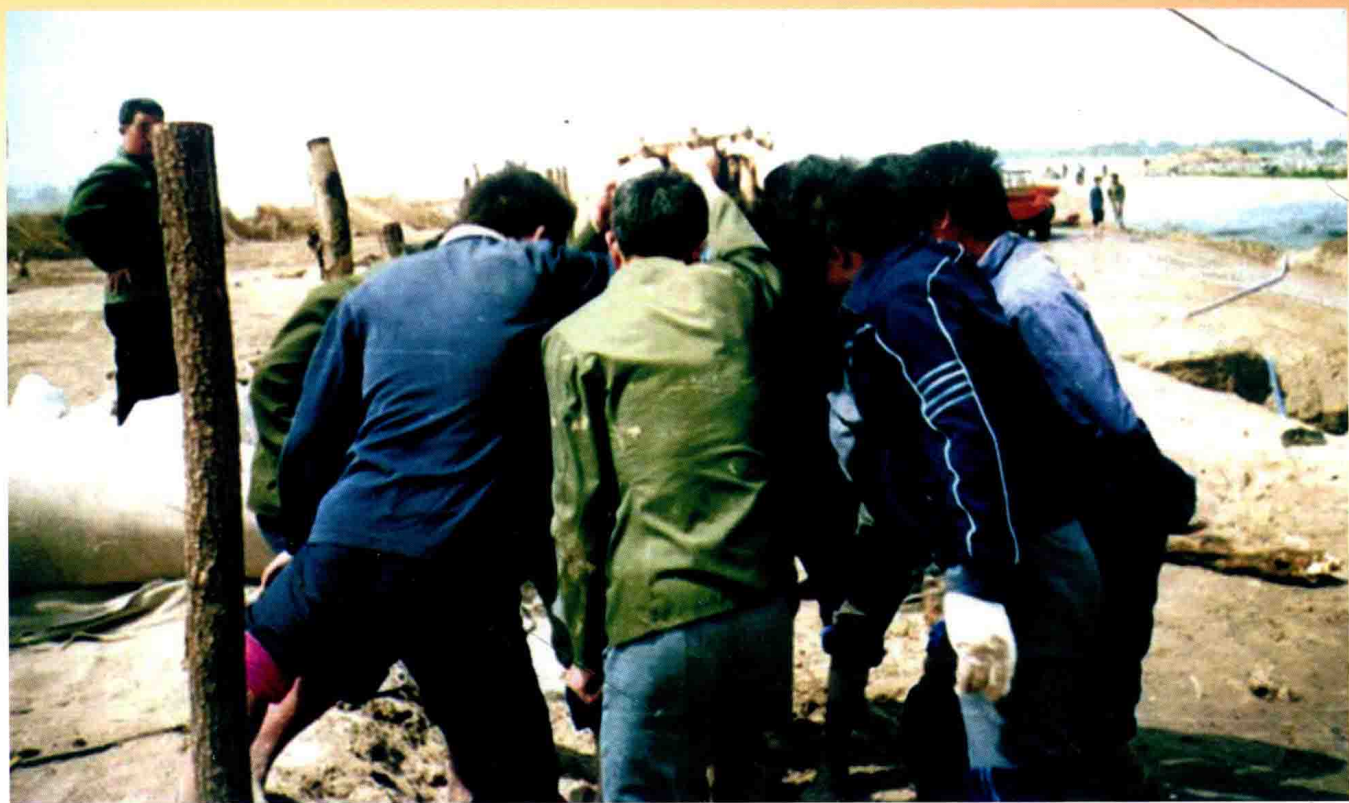
郑州黄河九堡控导工程人工打桩 (1990年)