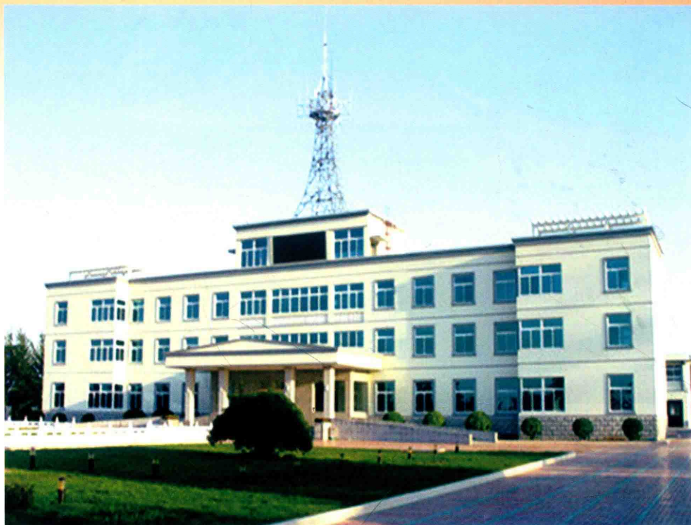
黄河花园口水位站 (2012年)