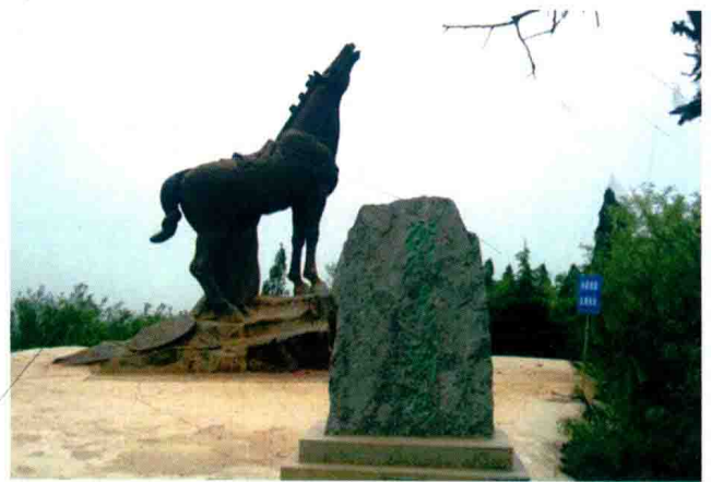
汉霸王城战马嘶鸣 (2013年)