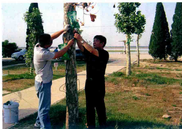
职工精心养护树木 (2012年)