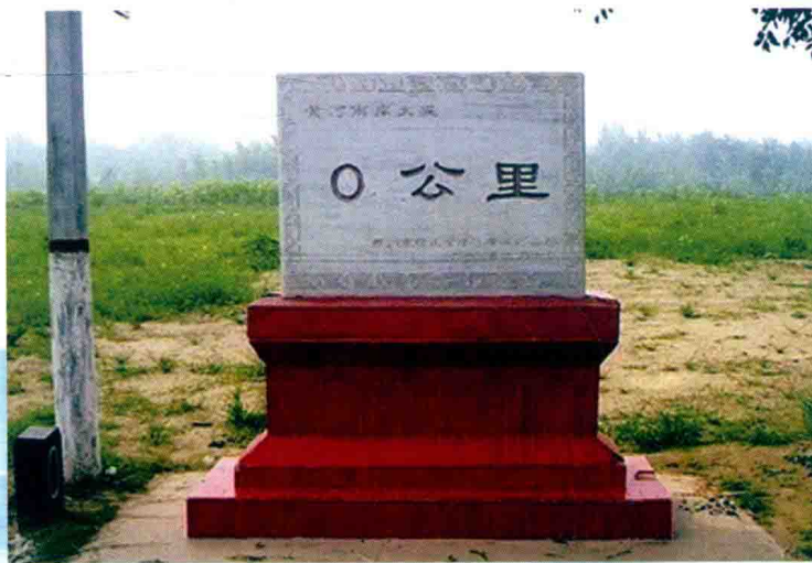
黄河下游右岸大堤里程碑 (2013年)