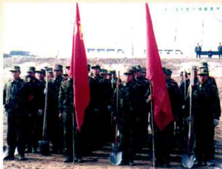
河南省、黄委会青年“保护母亲河行动”启动仪式在中牟黄河举行 (千米桩号 52+000 处) (1999 年)