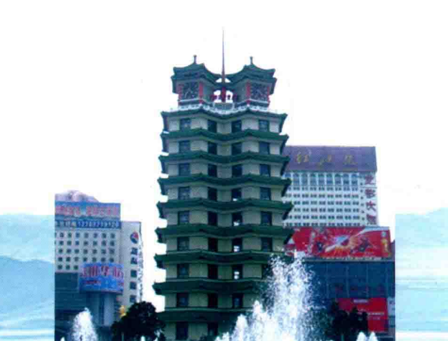
郑州二七纪念塔 (2013年)