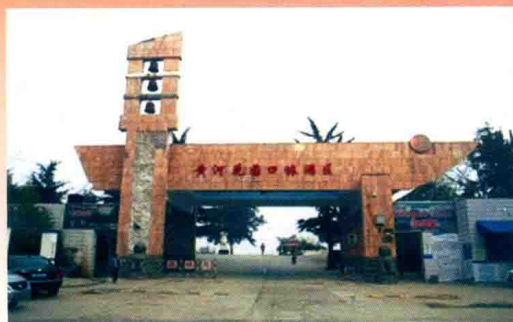
黄河花园口景区大门 (2011年)