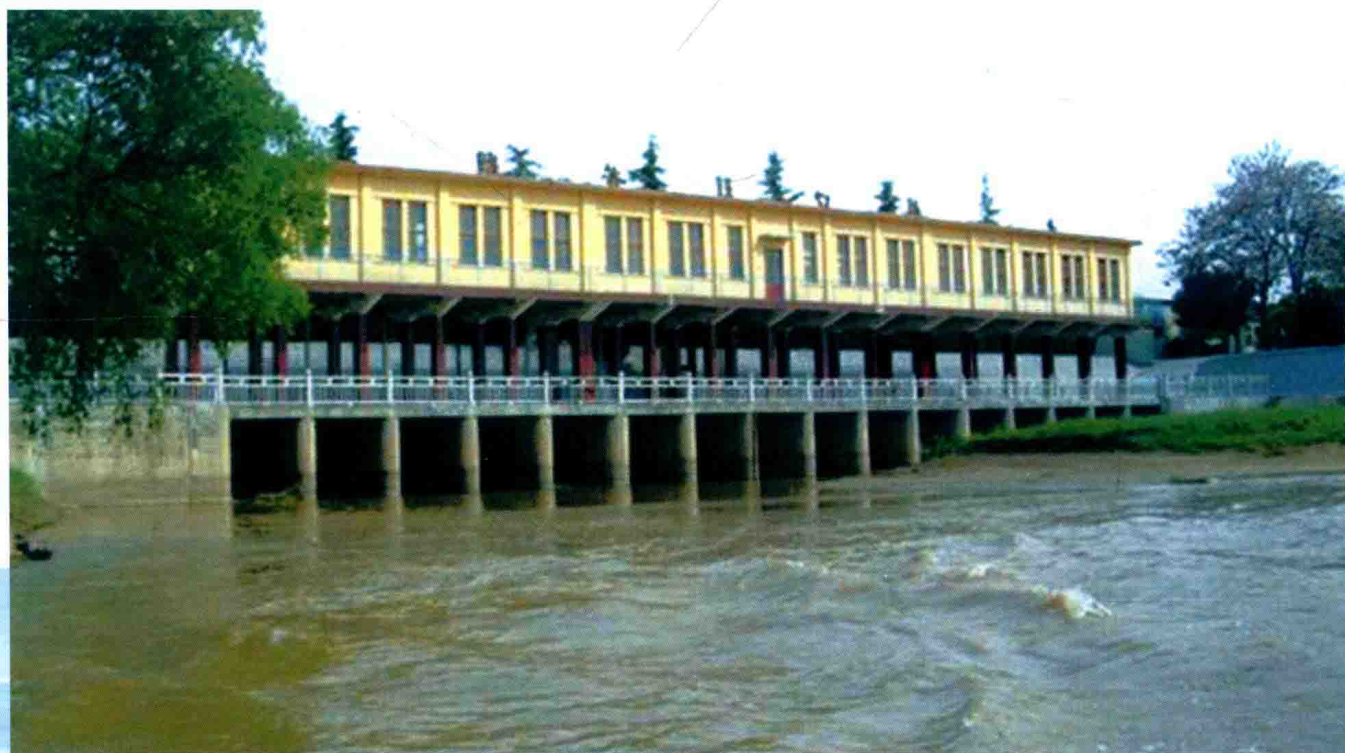
郑州黄河赵口引黄闸 (2011年)