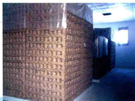
郑州黄河防汛麻料 (2012年)