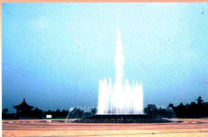
黄河花园口记事广场 (2013年)