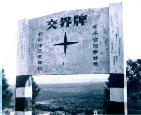
郑州、开封黄河交界牌 (堤防 千米桩号 70+250) (2002年)