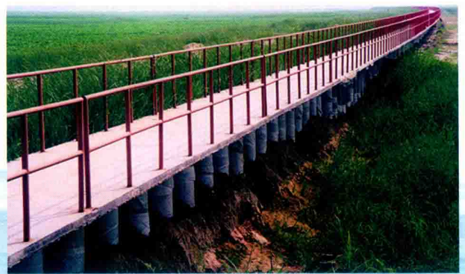
郑州黄河韦滩灌注桩工程 (2013年)