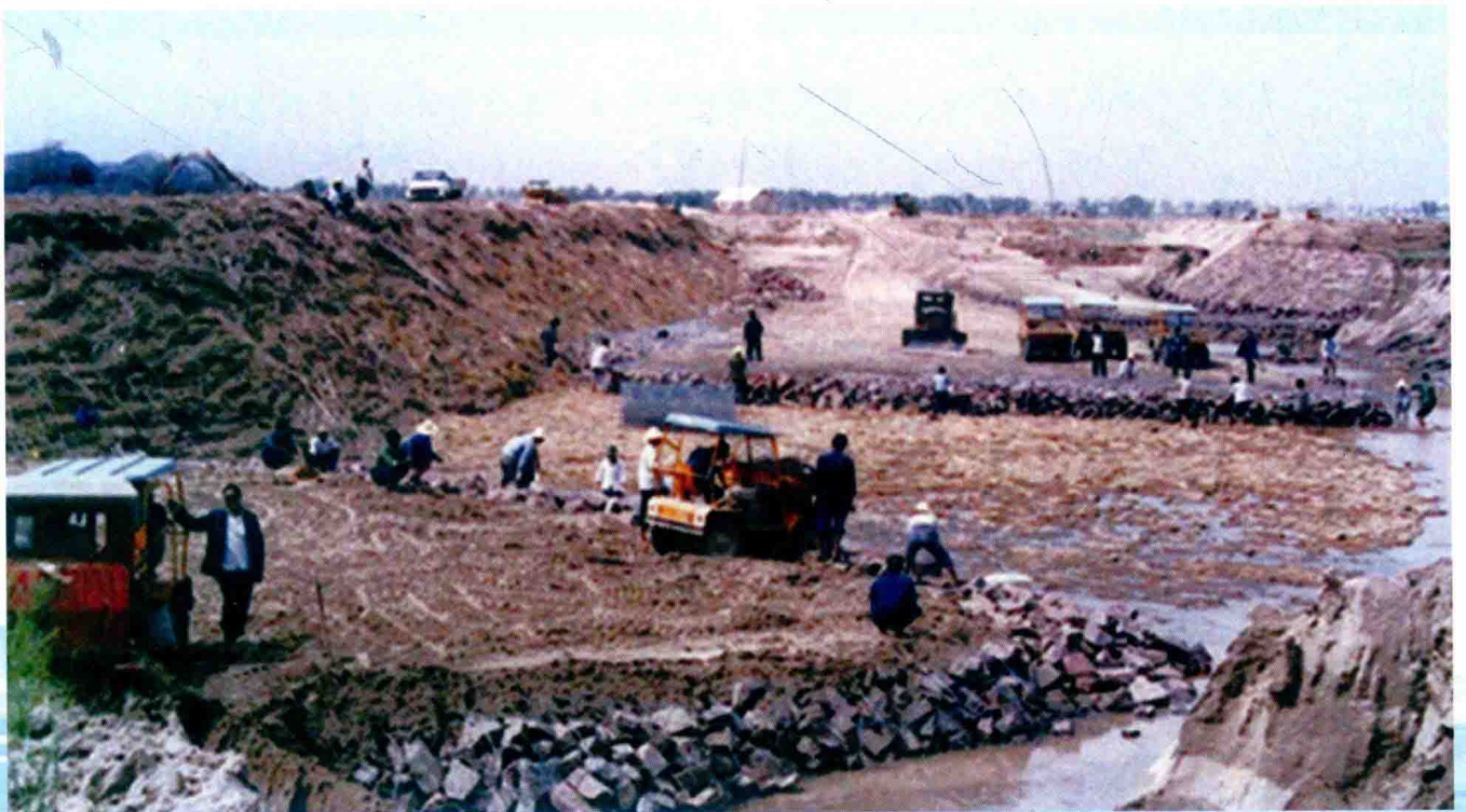
郑州黄河九堡控导工程沉排施工 (1990年)