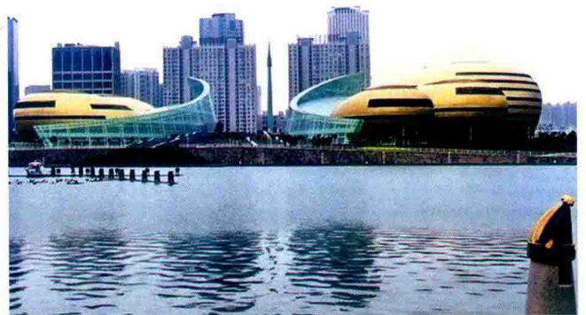
黄河水扮美丽的郑东新区 (2013年)