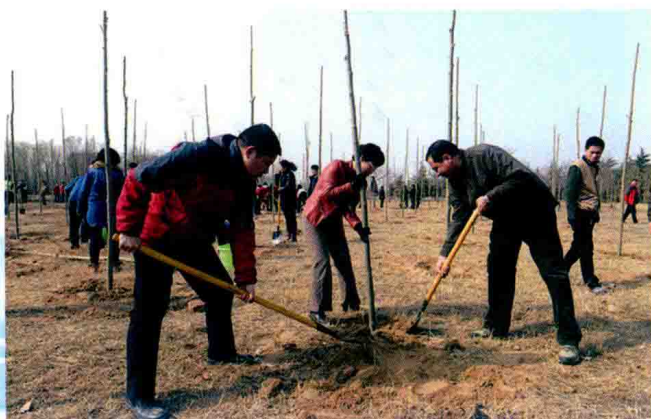
植树造林绿化黄河 (2014年)