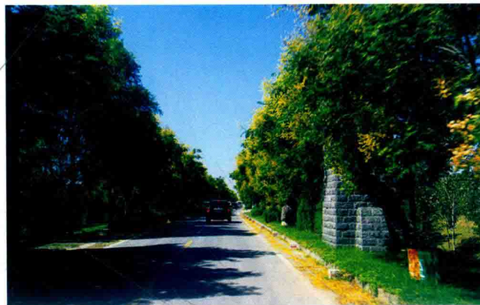
郑州黄河堤防栎树郁郁葱葱 (2012年)