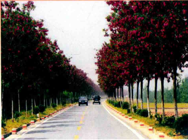
郑州黄河堤防春色 (2013年)