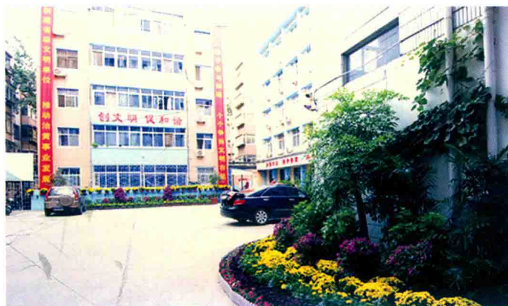
郑州河务局机关喜迎国庆 (2012年)