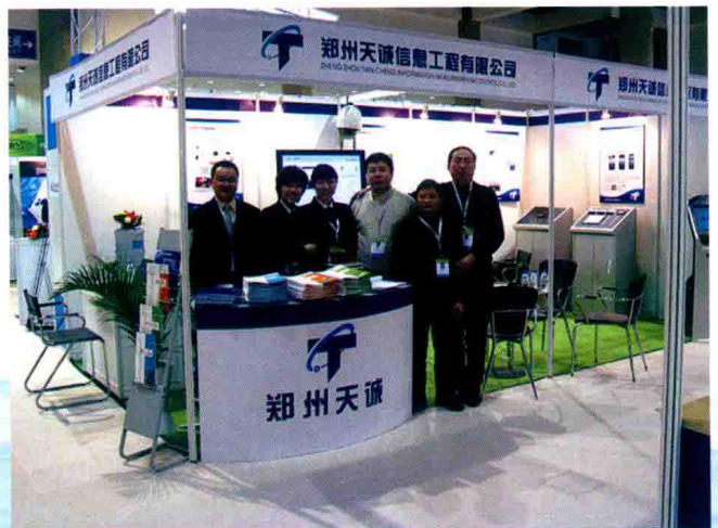
郑州天诚信息工程有限公司参加北京 水博会 (2009年)