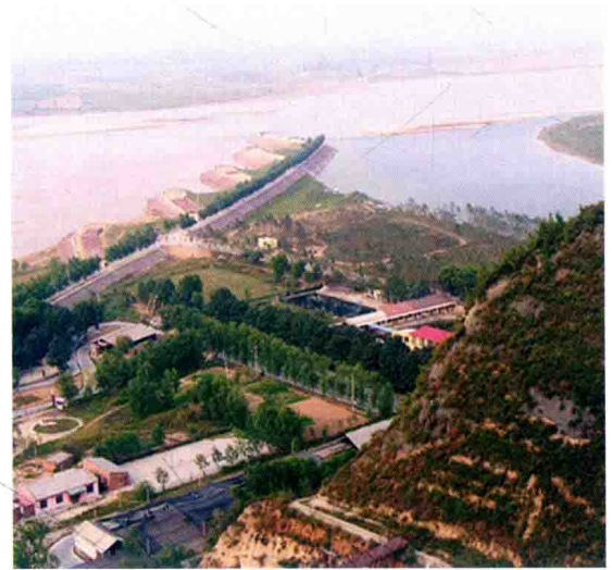
郑州黄河神堤控导工程 (2006年)