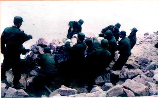
郑州黄河人工捆抛铅丝笼抢险 (1998年)