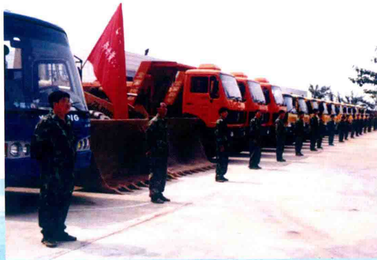
郑州黄河机械化抢险队整装待发 (2013年)