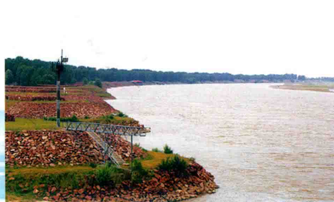
郑州黄河九堡控导工程 (2015年)