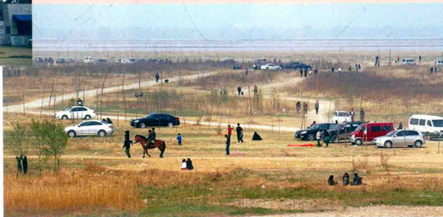
黄河花园口景区一瞥 (2011年)