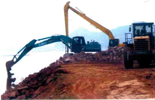
郑州黄河长臂机抛石整坡 (2012年)