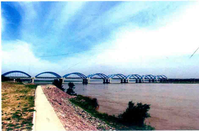
京珠高速公路郑州黄河特大桥 (2013年)