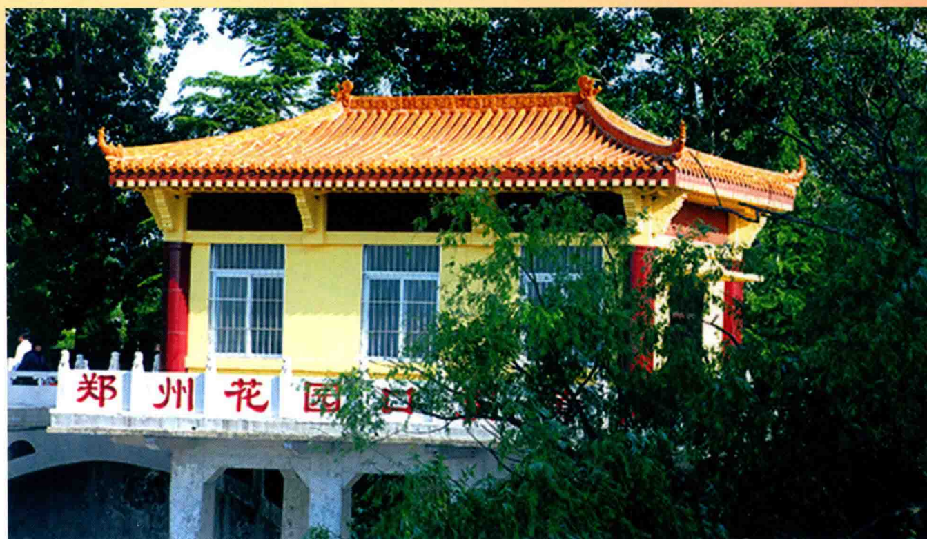
郑州黄河花园口引黄闸 (2007年)