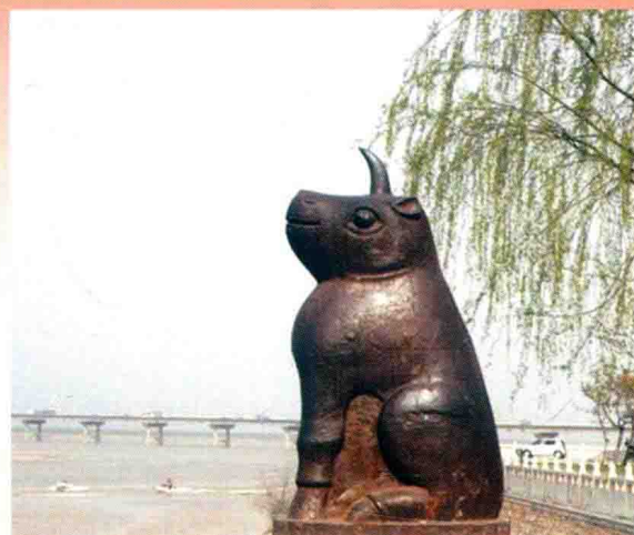
黄河花园口镇河铁犀 (2013年)