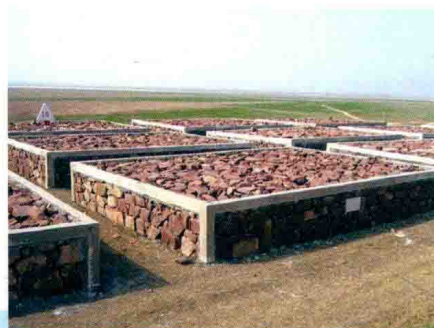
郑州黄河防汛石料 (2012年)