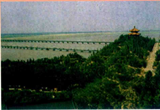
从邙山眺望黄河 (2010年)