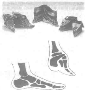
图 1.5 缠足使足骨骼严重变形

中国古时认为女性的脚越小越美（图 1.5），脚成了女性魅力的主要标志，你知道为什么吗？推荐通过网络百科（如百度百科）“裹足”做更多了解。