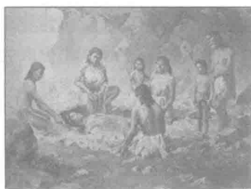
图 1.1 北京周口店山顶洞人的葬仪