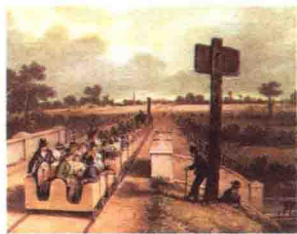
一幅描绘利物浦至曼彻斯特铁路开通时的石版画