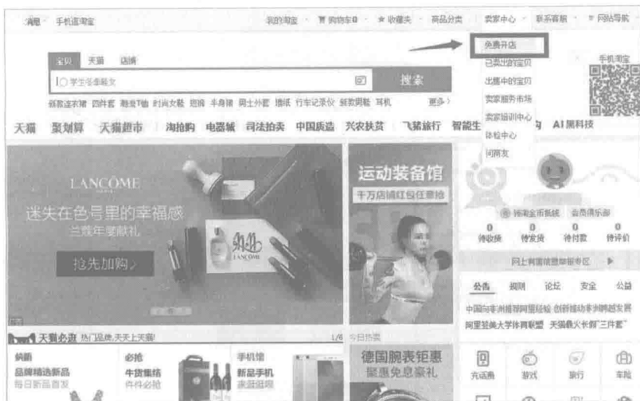
图 7 免费开店