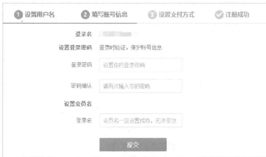
图 4 填写账号信息