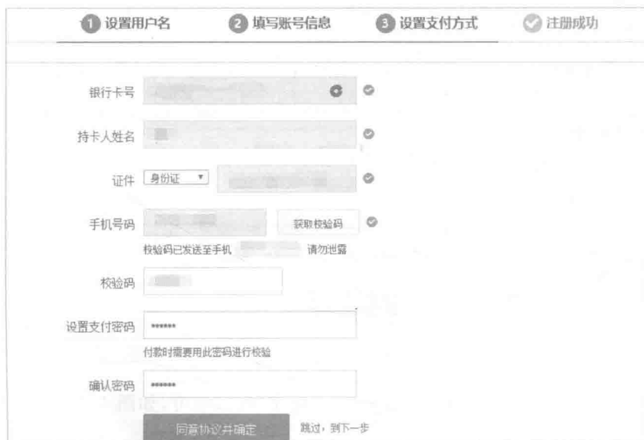
图 5 设置支付方式