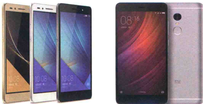
图1.8 华为荣耀7和小米NOTE4