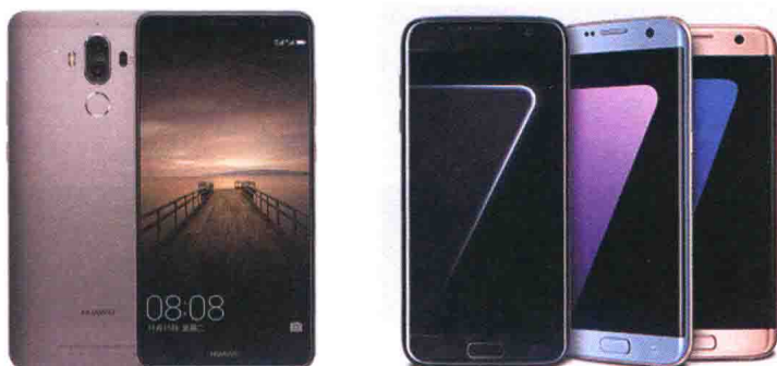
图1.9 华为Mate9和三星GALAXY S7