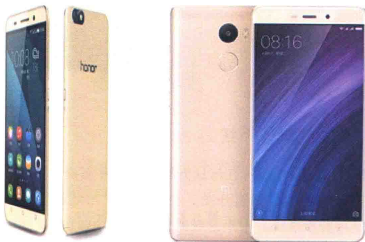
图1.7 华为畅玩4和小米红米4

目前市场上智能手机的价格可以分为三类：一类是价格在1000元左右，如华为公司的畅玩系列、小米公司的红米系列等，这些手机的性价比还是比较高的，如图1.7所示；二类是价格在1400~2500元之间，如华为公司的荣耀系列、小米公司的NOTE系列，如图1.8所示；三类是价格在3000元以上的，如华为公司的Mate系列和三星公司的GALAXY系列等，如图1.9所示。一般来说，价格越高，其性能越好，但选择适合自己的手机很重要。