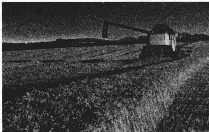
图 1-1 乡村的生产功能

乡村通常都是以从事农业生产为重点的劳动者聚居的场所，是指从事农林牧渔业为重点内容的非都市区域，表现出农业、农村与农民人文活动的典型特点。而乡村的诞生根本原因主要是农业的产生及其发展(图 1-1)。乡村最先就是农业生产的直接载体，乡村的存在形式往往也进一步契合了农业生产在空间层面的直接需求。所以，乡村的存在往往也是为农业生产服务的，乡村的规划最先要实现的就是其生产功能。乡村建设一定要充分利于农业的生产、农村的手工业传承与发展。根据城镇的建设思路对乡村进行改造，不仅彻底改变了农民发展生产与农业的初衷，同时也失去了乡村的基本功能。