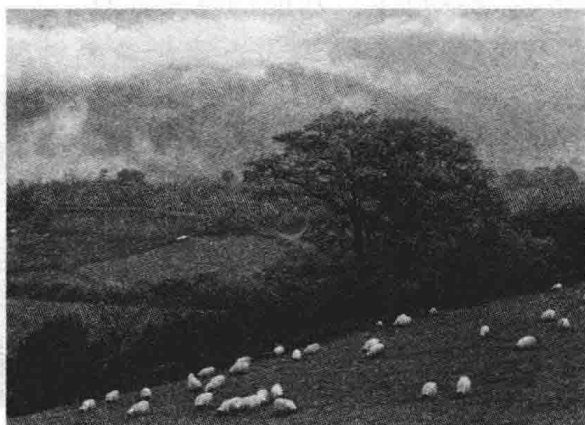
图 1-3 乡村生态环境

以自然资源作为主体的乡村生态系统是一个高度敏感的地带,也非常的脆弱,所以,在规划的过程中需要严格地保护好原有的农田、林地、水体等一些比较传统的乡村空间,避免生态平衡系统被人为地破坏掉,通过建设生态型的乡村进一步改善农村的生活环境(图 1-3)、进一步提高农村居民的生活质量和生活水平,进而促进乡村地区的可持续发展。