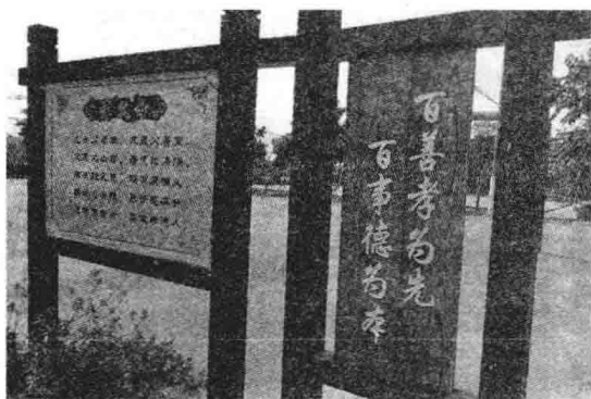
图 1-4 乡村传统文化的传承

目前,有的地方在美丽乡村建设过程中不仅没有传承文化,还丢失了乡村的原有文化风俗。规划师不仅需要懂得民族文化与乡村文化,很多的规划设计还不能一味地参照城市规划的方法,出现一种“不伦不类”的蹩脚景观,使乡村的精神内涵丧失。