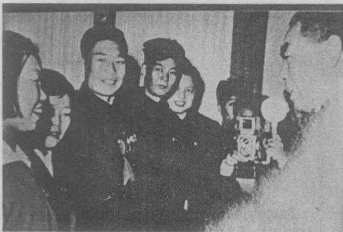
1959 年，徐学惠受到周恩来总理的亲切接见。