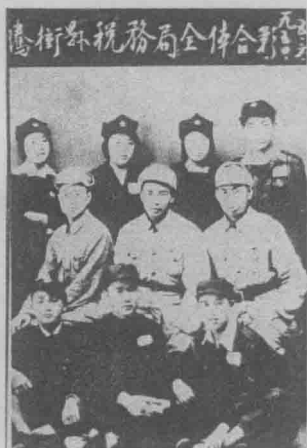
1950年騰冲稅務局全 体干部。