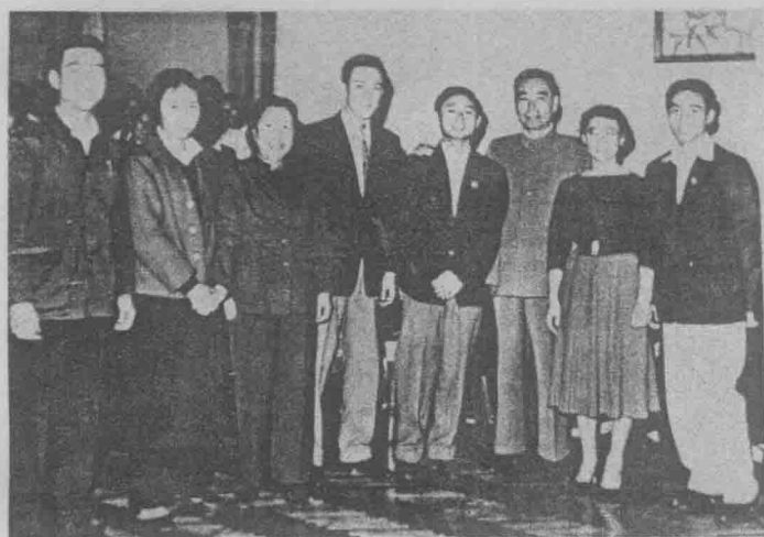
1961年腾冲籍女青年、获世界女子乒乓球女子团体、女子单打冠军的邱钟惠（右二），受到周恩来总理和邓颖超同志的亲切接见。