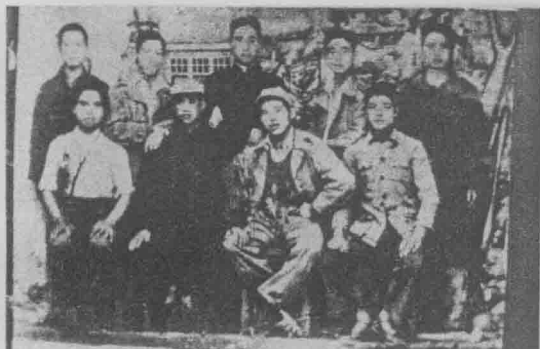
“边纵”36团部分 干部战士。