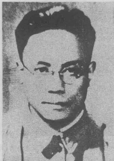
艾思奇（1910～1966）， 腾冲和顺水碓村人。1935年 加入中国共产党，著名马列 主义哲学家。