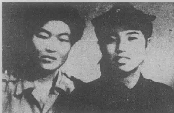
边纵 36 团女战士。