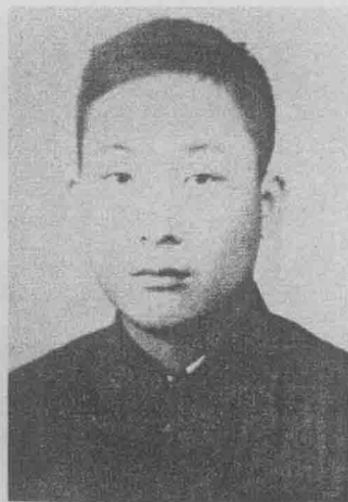
赵鼎（1927～1979）剑川县金华镇人，1948年5月加入中国共产党，1950年任中共腾冲县委书记。