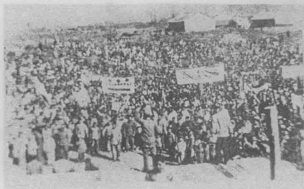
1949年12月腾冲临时解放委员会成立，图为大会会场。