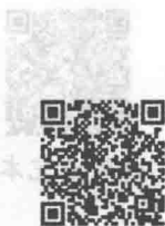
习题与思考题答案