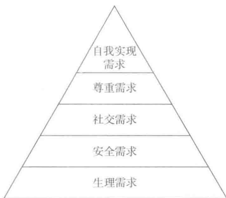
图 1-1 人的需求层次

美国心理学家亚伯拉罕·马斯洛 1943 年在《人类激励理论》中提出人的需求层次理论，将人类的需求从低到高分为五个层次：生理需求、安全需求、社交需求、尊重需求和自我实现需求（见图 1-1）。