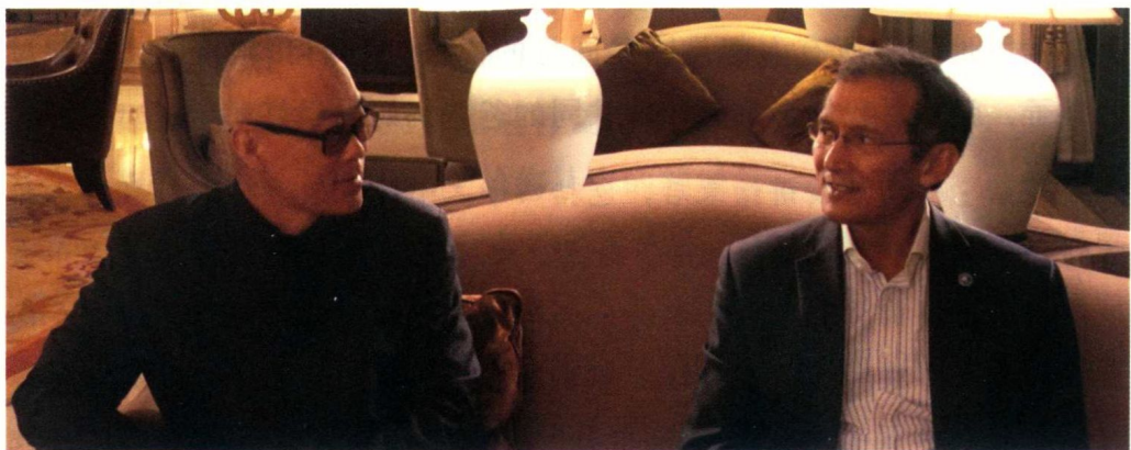
郑渊洁和吉尔吉斯斯坦前总理卓奥玛尔·奥托尔巴耶夫第一次对话