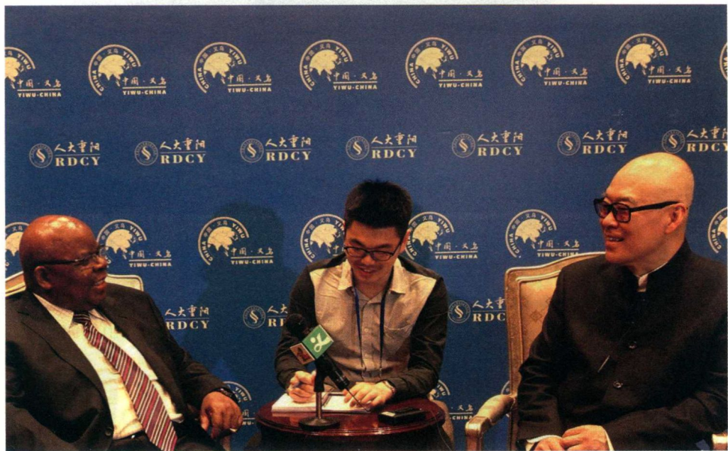
郑渊洁和坦桑尼亚前总统本杰明·姆卡帕

花絮： 郑渊洁演讲结束后，包括四十二个国家政要到现场数百人排队到郑渊洁的座位前和他握手、合影。之前已经和郑渊洁对话的吉尔吉斯斯坦共和国前总理卓奥玛尔特·奥托尔巴耶夫听了郑渊洁演讲后，向主办方要求再次和郑渊洁对话。郑渊洁在登机返回北京之前再次和吉尔吉斯斯坦共和国前总理卓奥玛尔特·奥托尔巴耶夫对话一小时。2016年11月17日，郑渊洁义乌演讲《童话都不敢这么写》刊登在微信公众号、微博和博客后，在全国被疯狂传阅转发，阅读量近千万。