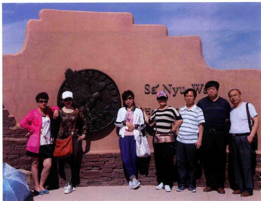
2013年5月，在美国加州考察职业教育