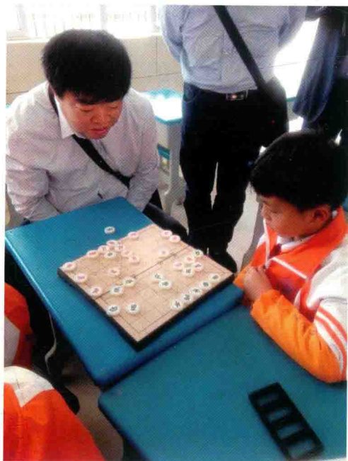
2016年春，在教室与小学生对弈