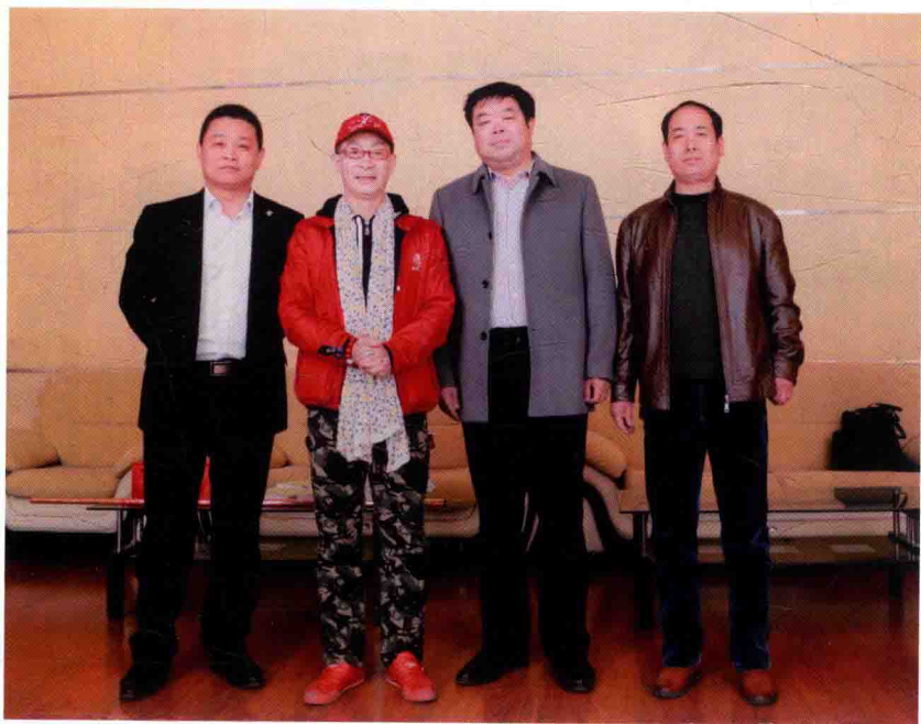
2014年秋，与孙悟空扮演者六小龄童合影