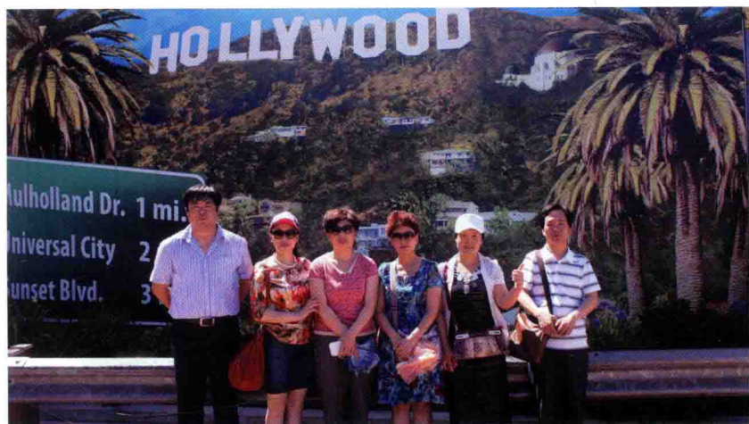
2013年5月，在美国好莱坞考察学习