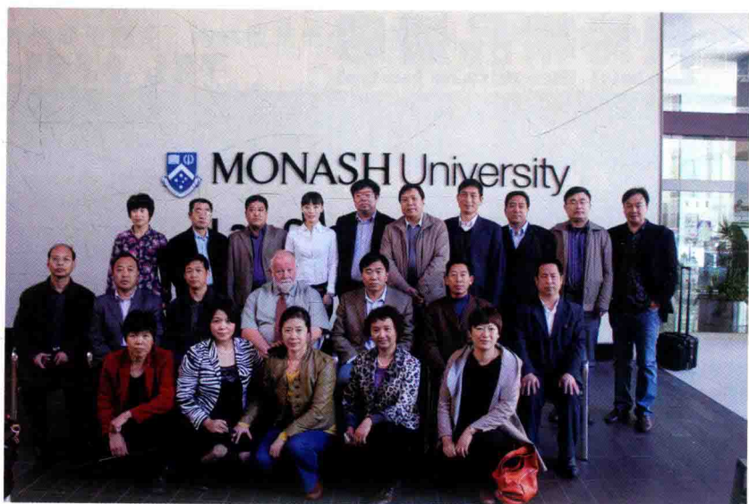
2016年暑期，与同仁参加干部培训