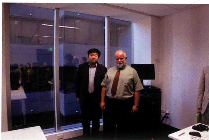
2016年12月，与澳大利亚悉尼大学洛斯汀教授合影