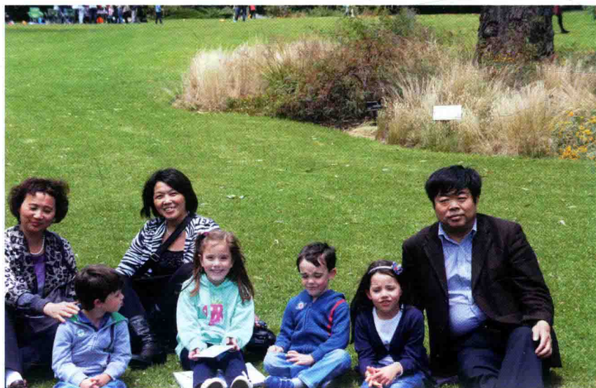
2012年12月，与澳大利亚墨尔本幼儿园小朋友在一起