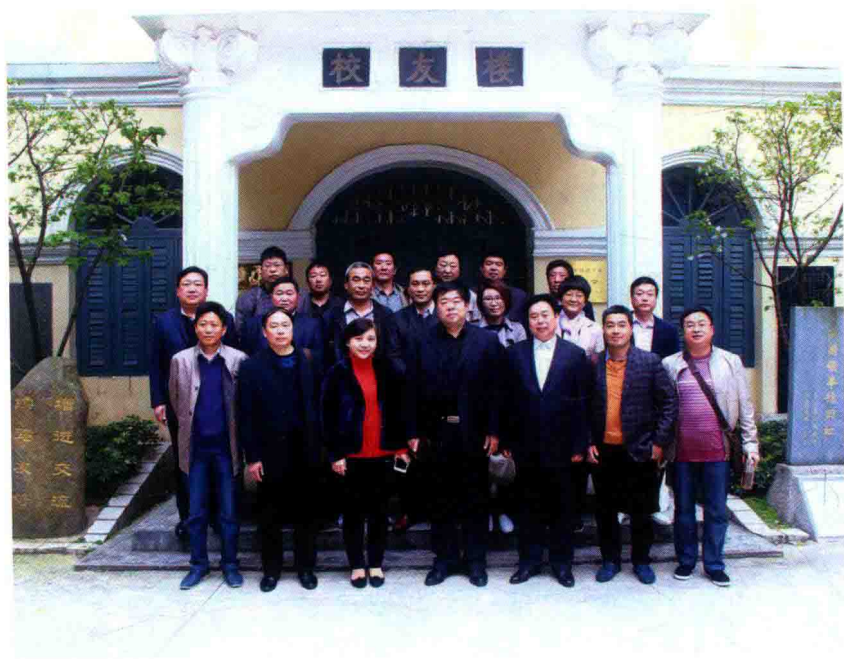
2016年5月，福州市名校考察学习