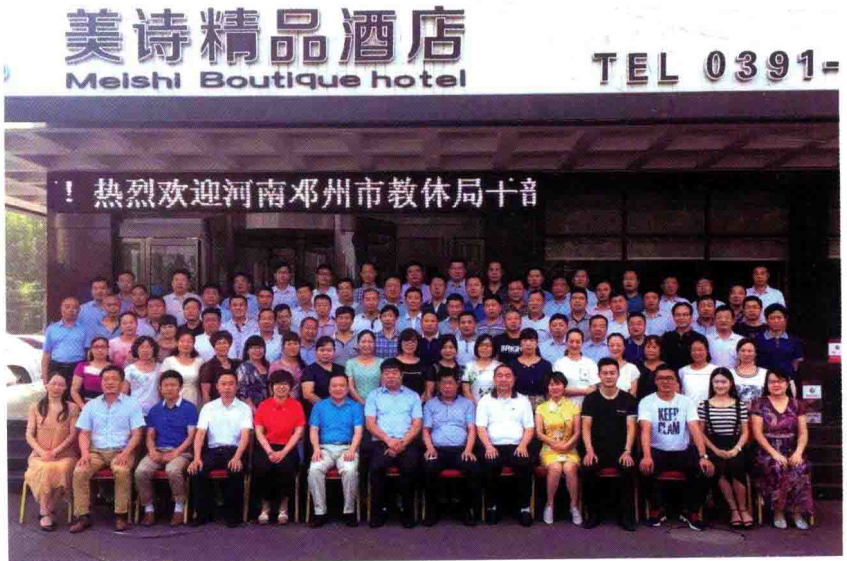
2016年夏，与名校长、名班主任、名师参加国家培训