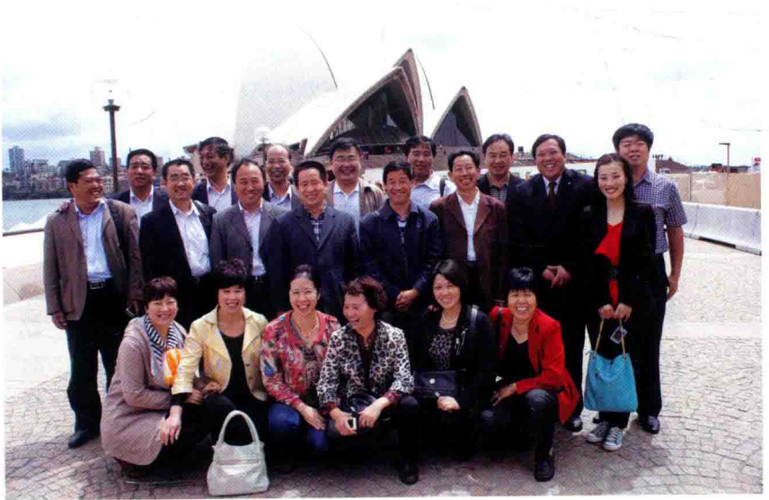
2012年12月，参加澳大利亚悉尼大学基础教育管理培训