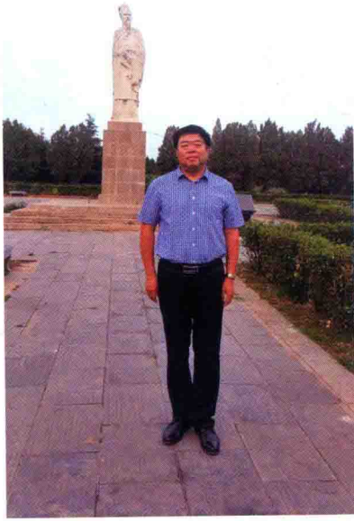
与诗人苏东坡先生塑像留影