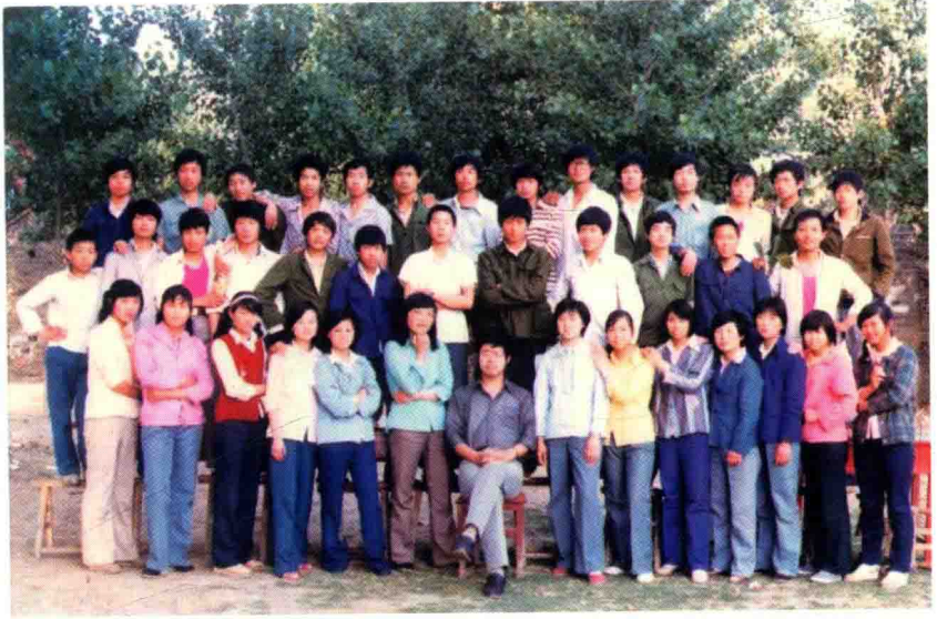
1987年，与学生们在一起