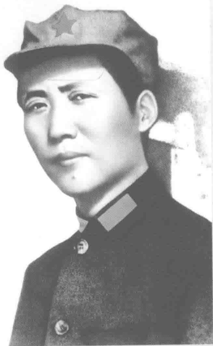
毛泽东 (井冈山前委书记、红四军党代表)