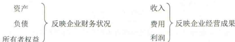
图 1-2 会计要素

会计要素是根据交易或者事项的经济特征所确定的财务会计对象及其基本分类。会计要素按照其性质分为资产、负债、所有者权益、收入、费用和利润。