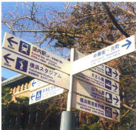
图 1-2-4 日本横浜道路标识