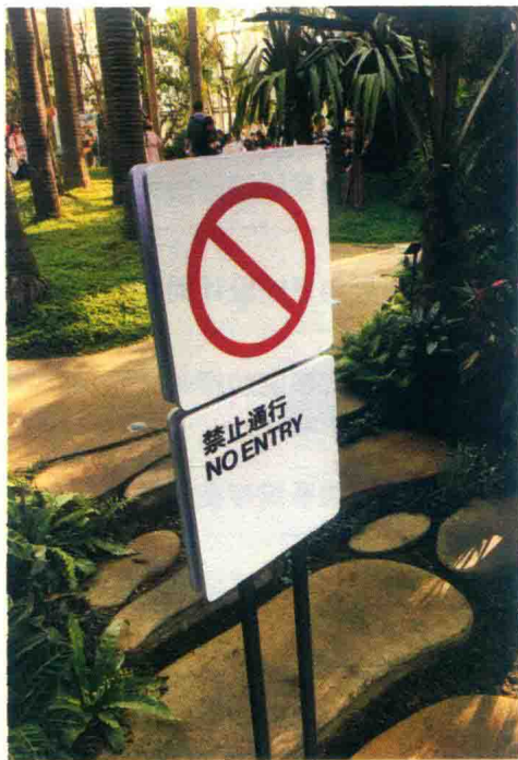
图 1-1-1 标识的概念

“标识”与“标志”在我国古汉语以及《辞海》中是同义词，标识就是某一事物的标志。在现代用语中，“标识”与“标志”还是存在着不同的意义范围，“标志”一般是指能够指代某种或某类事物的图形与文字相结合的符号，是某一类具体事物的表征；而“标识”这一名词所涵盖的范围和领域更广泛一些，它是指信息情报视觉传达的媒介和符号，不仅能代表图形、符号和文字，还可以用于表述事物的特征、指令和方向，