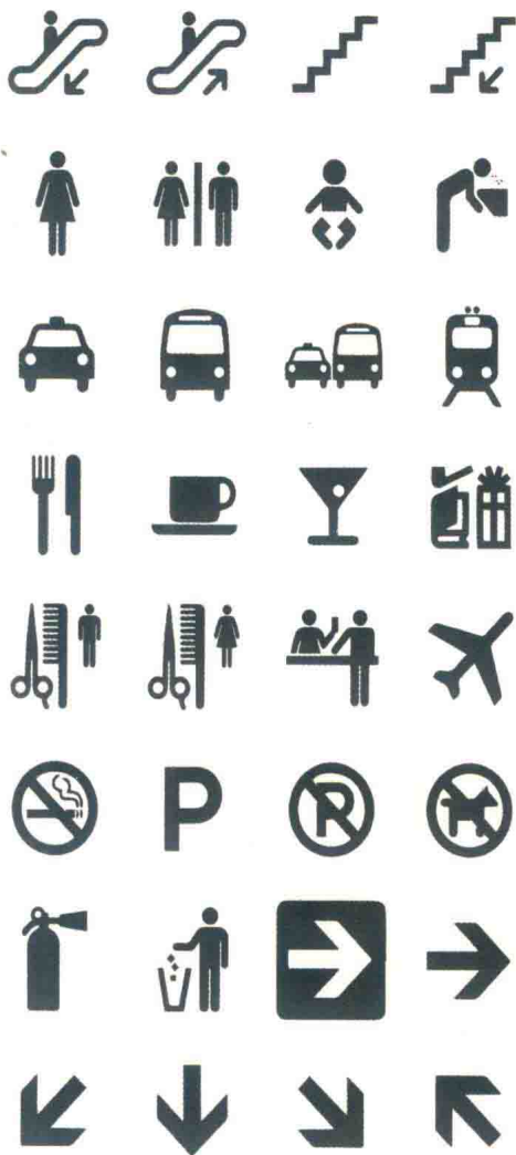
图 1-1-2 公共环境标识符号