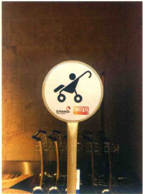
图 1-2-2 新加坡机场公共婴儿车标识

在标识导向设计中，文字字体与大小的选择，会直接影响导视信息的传达。因此，合理的字体选择和规范运用可以提升使用者对标识的可读性，使导向信息清晰、明确、快速地传达给使用者。设计者必须保持严谨的工作态度，仔细测量分析字体的比例、大小、高度，在对标识本体结构进行仔细分析研究后，还需考虑标识导向所处的环境位置，以及各类使用者所站在的不同视角。在标识导向设计中常用到的文字是汉字、拉丁文字和数字。这三类文字的笔画结构和视觉差异较大，在标识导向