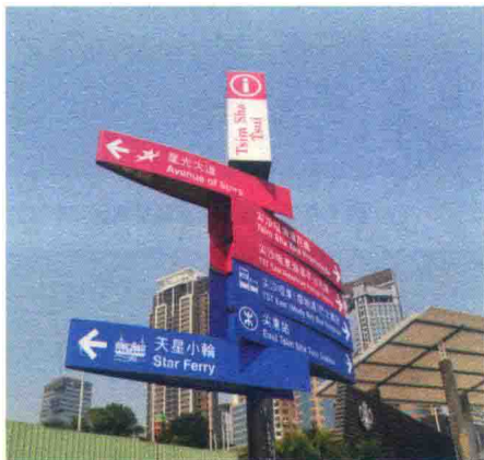
图 1-2-5 香港尖沙咀道路标识