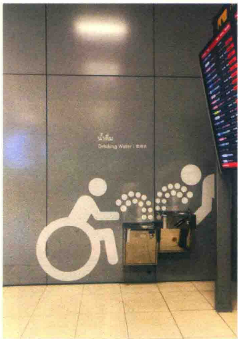
图 1-2-3 泰国机场饮水机处的标识图形