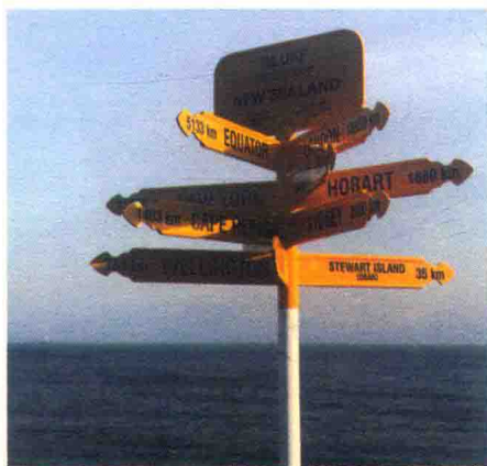
图 1-2-6 新西兰公共标识