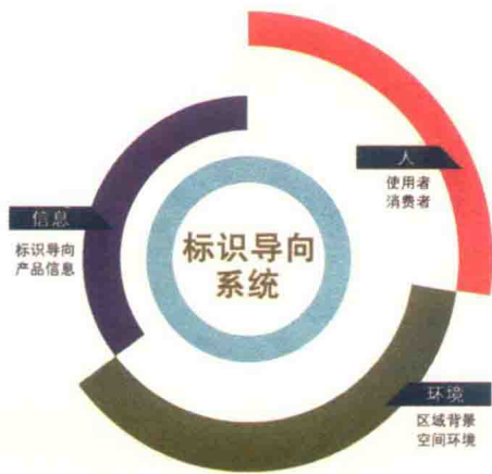
图 1-1-3 人、信息、环境三者关系

视觉符号和表现形式，它可以是建筑物，也可以是公共雕塑。如我们走在巴黎市区的街道里，埃菲尔铁塔始终都是我们行动的导向坐标，可以通过它的指引来确定自己行走的方向是否正确。另外，迪拜的哈利法塔、上海的东方明珠塔、东京的晴空塔、纽约的自由女神像等都是具有导向意义的标志型构筑物。