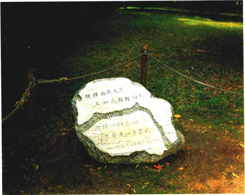
英国剑桥大学为徐志摩所立中文诗碑