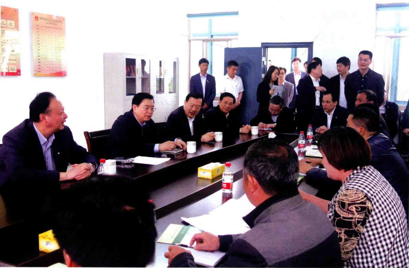
5月11日，中共中央政治局常委、全国人大常委会委员长张德江在湖州调研乡镇人大工作