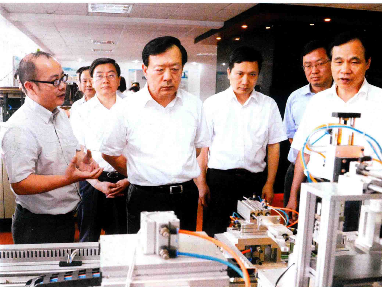
9月2日，省委书记、省人大常委会主任夏宝龙（前排左二）在湖州调研工业经济运行情况