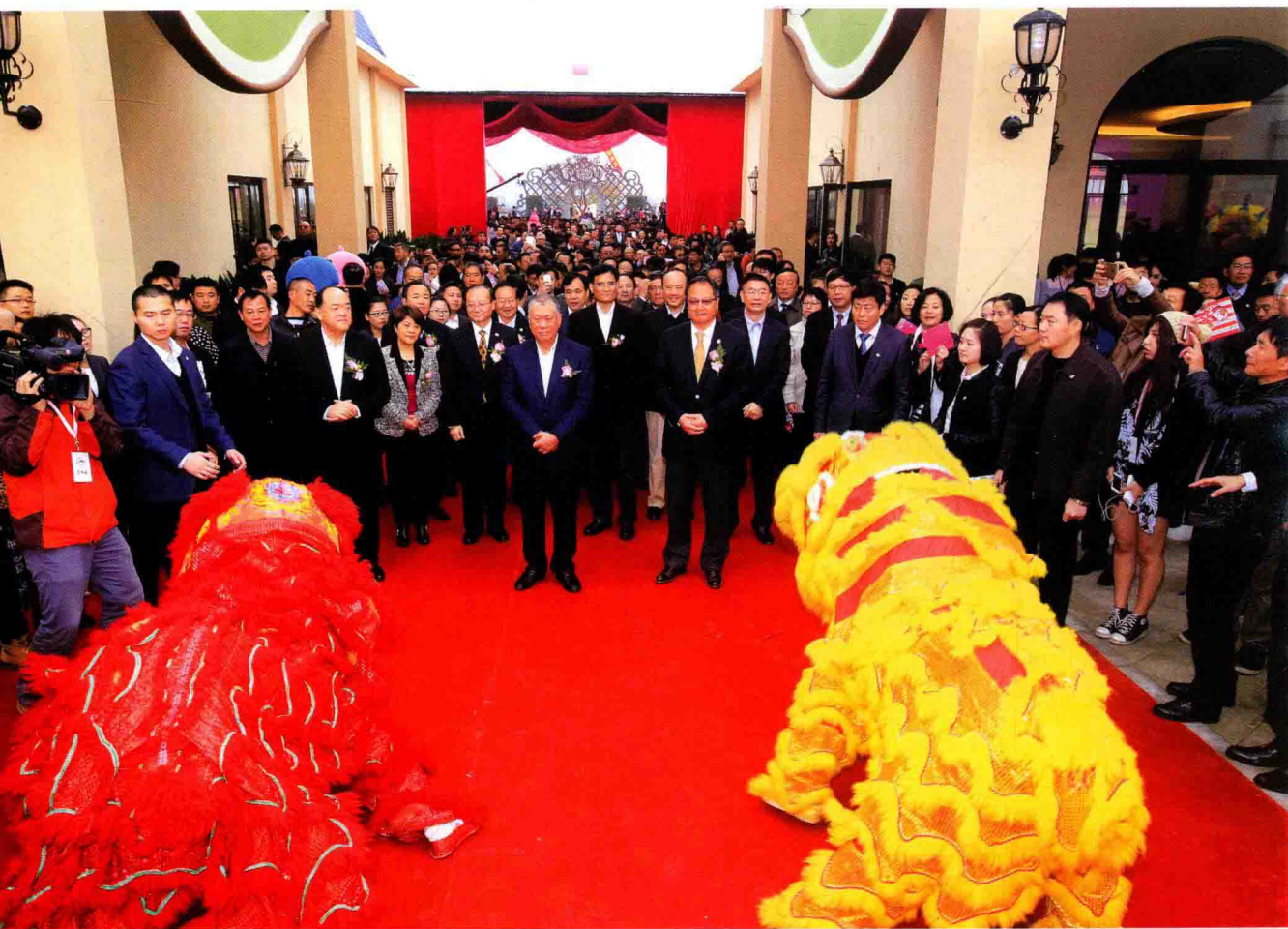
11月28日，全国政协副主席何厚铨（前排中）出席国内首个凯蒂猫家园项目在安吉县落成仪式