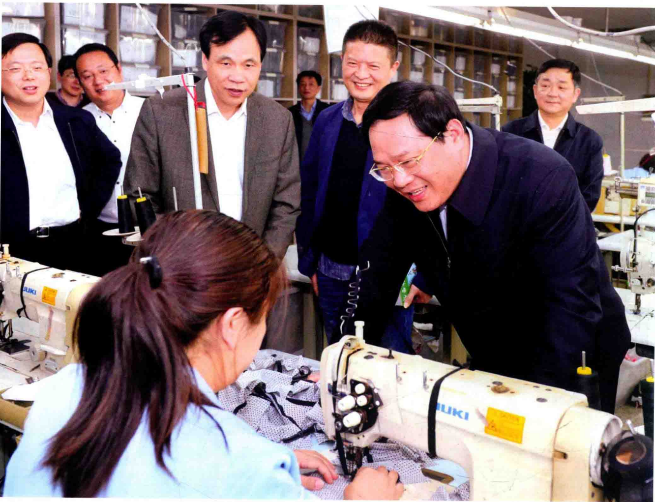
3月17~18日，省委副书记、省长李强（右一）在湖州调研