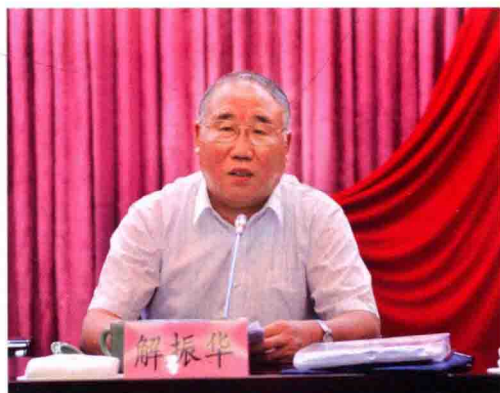
国家发改委副主任解振华讲话