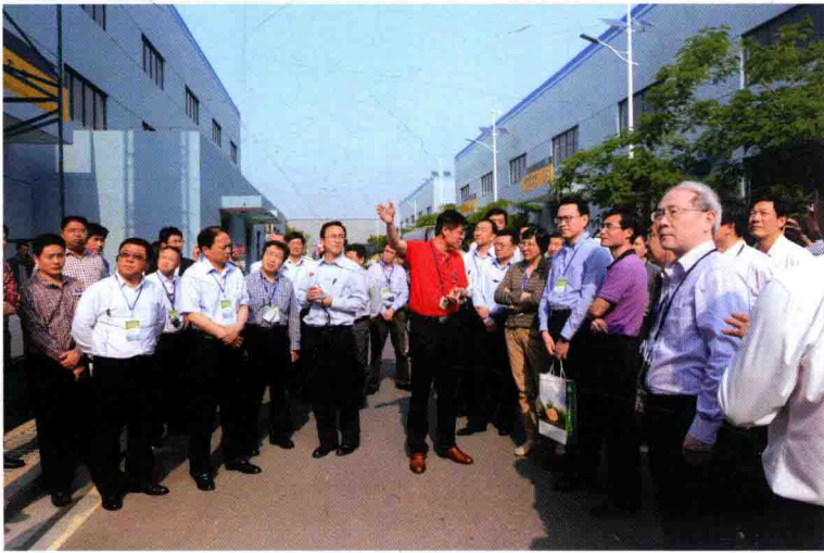
与会代表考察长兴县超威集 团铅蓄电池行业转型升级