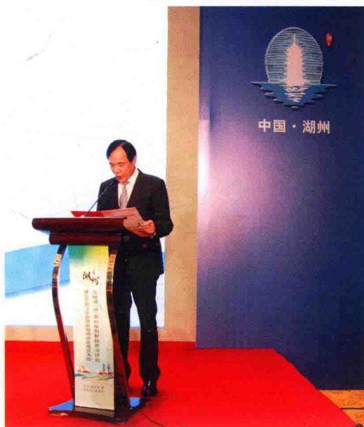
市委书记马以致辞

10月29日，湖州市央企对接恳谈会、湖州市与全国工商联直属商会新兴产业对接会在北京举行。市委书记马以、市委副书记金建新分别出席活动并致辞；国务院国资委政策法规局副局长肖福泉，市领导高屹、李建平、曹德平和全国工商联直属商会、有关央企、湖州市各县(区)及重点企业负责人等出席活动。在活动期间，一批“大好高”合作项目现场签约，总投资达259亿元。