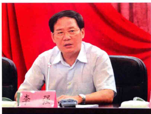
省委副书记、省长李强讲话

全国首个以设区市为单位的生态文明建设方案，经国务院同意，由国家发改委、财政部、国土资源部、水利部、农业部、国家林业局批复。7月30日，省委、省政府在湖州召开浙江省湖州市生态文明先行示范区建设动员大会。省委书记、市人大常委会主任夏宝龙作出批示。省委副书记、省长李强，国家发改委副主任解振华，市委书记马以出席并讲话。省政府秘书长李卫宁，国家有关部委负责人和市领导陈伟俊、朱坤民、吴水霖、金建新等出席会议。