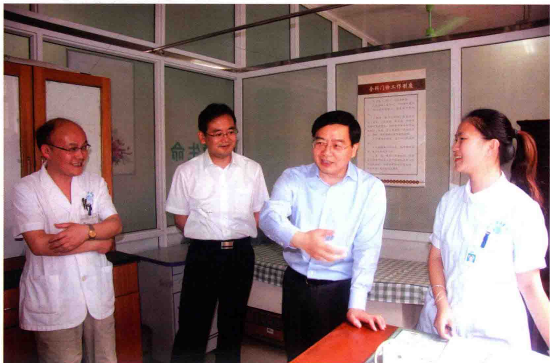
5月29日，市长陈伟俊（右二）调研指导中心城区社区卫生服务工作