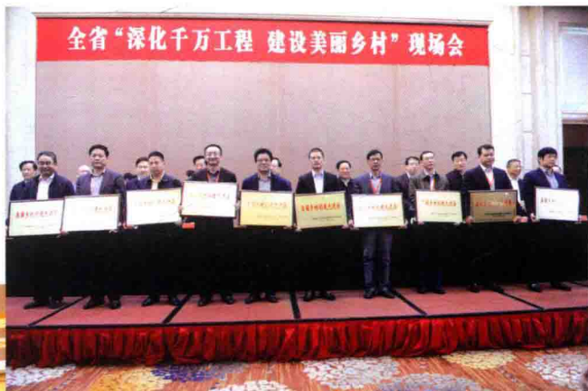
表彰2014年度全省美丽乡村创建先进县

11月13~14日，浙江省“深化千万工程 建设美丽乡村”现场会在湖州市德清县召开。省委书记夏宝龙、省长李强到会并讲话。省委副书记王辉忠主持会议。省领导龚正、赵一德、刘奇、程渭山、黄旭明等出席。会议表彰了2014年度全省美丽乡村创建先进县。市委书记马以在会上介绍了湖州美丽乡村建设有关经验。