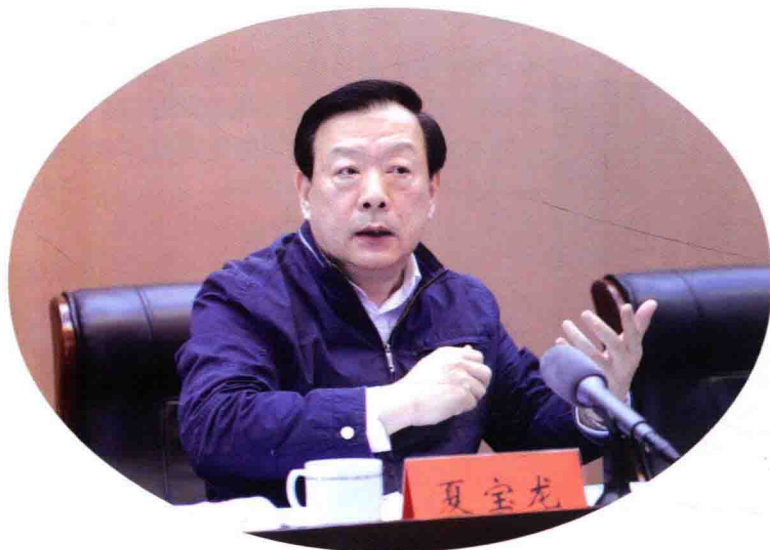
省委书记夏宝龙讲话

11月13~14日，浙江省“深化千万工程 建设美丽乡村”现场会在湖州市德清县召开。省委书记夏宝龙、省长李强到会并讲话。省委副书记王辉忠主持会议。省领导龚正、赵一德、刘奇、程渭山、黄旭明等出席。会议表彰了2014年度全省美丽乡村创建先进县。市委书记马以在会上介绍了湖州美丽乡村建设有关经验。