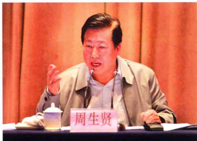
环境保护部部长周生贤出席会议并讲话

5月20日，全国生态文明建设现场会在湖州召开。中共中央政治局常委、国务院副总理张高丽对会议作出批示。环境保护部部长周生贤出席会议并讲话，副部长李干杰主持会议；浙江省副省长黄旭明致辞；湖州市委书记马以代表湖州在会上作题为“践行生态文明、打造美丽湖州”的交流发言，介绍湖州生态文明建设经验。