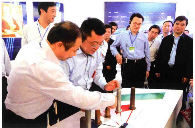
与会代表考察长兴县天能 集团铅蓄电池行业转型升级