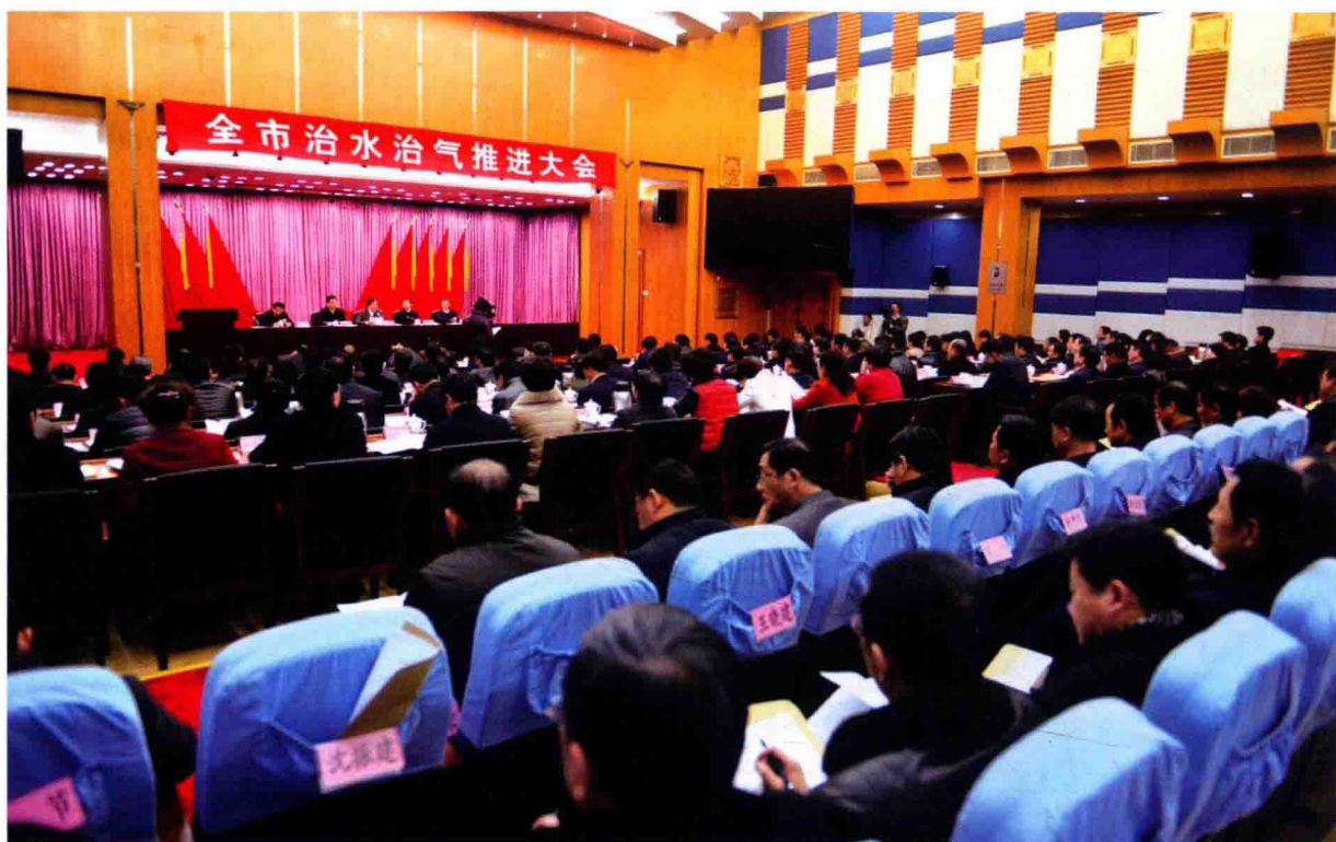
2月7日，市委、市政府召开全市治水治气推进大会