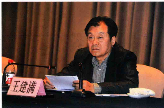
省政府党组副书记、省政府顾问王建满讲话

4月29~30日，全省“三改一拆”行动第四次现场会暨“无违建县（市、区）”创建动员大会在湖州召开。省政府党组副书记、省政府顾问王建满到会并讲话；市长陈伟俊致辞。29日，来自全省各市、县（区）的与会代表参观了吴兴区、南浔区和湖州经济开发区的“三改一拆”现场。