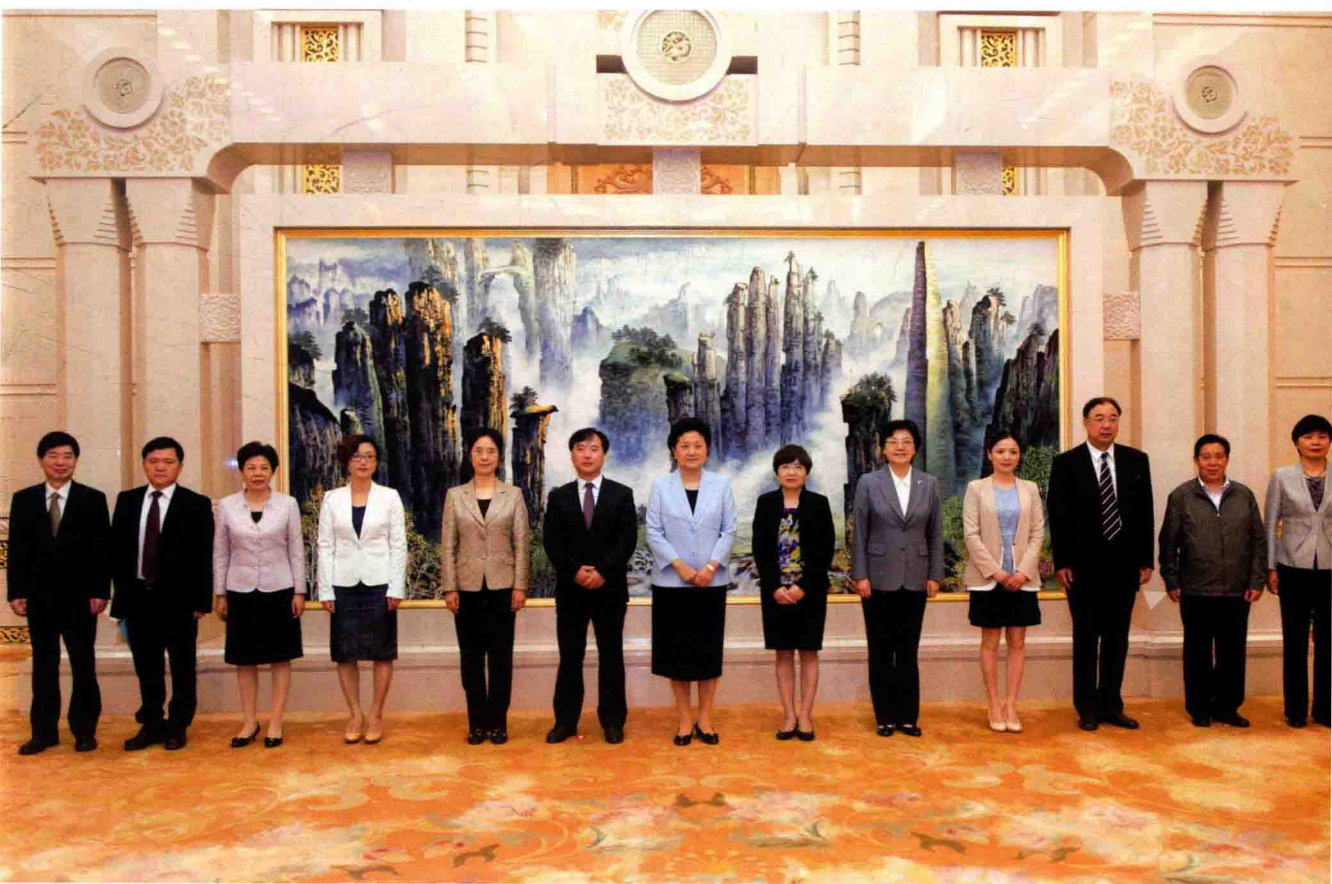
5月13日，中共中央政治局委员、国务院副总理刘延东在北京人民大会堂接见省皮肤病防治研究所上柏（湖州德清）住院部先进事迹报告团全体成员