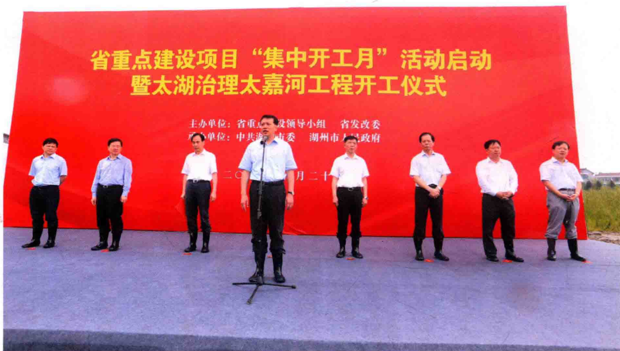
8月20日，省重点建设项目“集中开工月”活动启动暨太湖治理太嘉河工程开工仪式在湖州举行