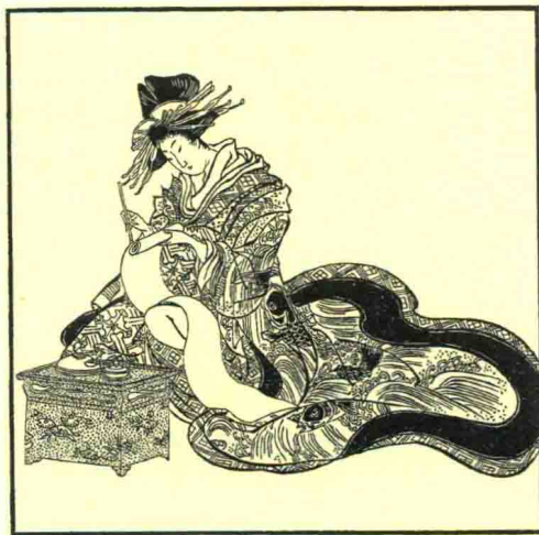
图 113 选自《一对男时花歌川》