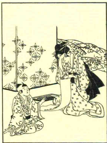
图 112 选自《锦书恨》