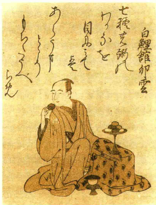
图 115 选自《狂歌三十六歌仙》

但它对于学习绘画的学生非常有用，显示了歌川丰广也像北尾政美一样试图模仿狩野派的风格。我们从他的真迹样本中选了—幅画，画的是一位年轻的美人乔装打扮成隐者铁拐（手绘版画 119）。我们将它与歌川丰春和歌川丰国的作品对比后发现，这幅画的笔法柔和细腻，人物的面容比例也十分协调。因此也可以看到他十分专注于创造新的风格，而歌川丰国则愿意采用他师父的绘画方法。我们必须承认，歌川丰广的绘画特点导致他并不喜欢歌川丰国为了迎合社会底层人士的需求而为当红演员绘制肖像画这种工作。我们更喜欢歌川丰广创作的美人图，以及他描绘礼仪和风俗的插画。