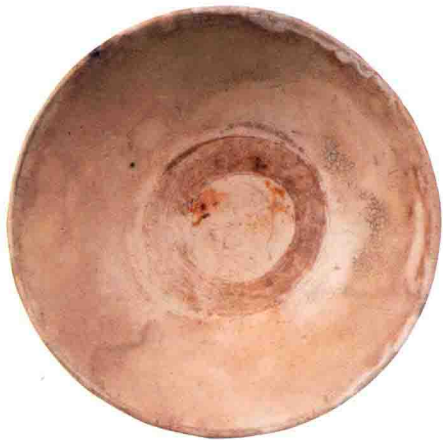
▲图 1-4 白瓷碗 明代