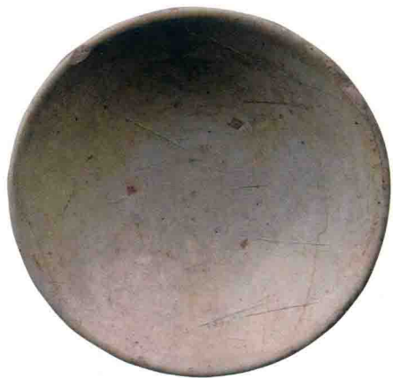
▲图 1-6 精致的邢窑白瓷碗 唐代

试想邢窑完全可以将不暴露在外面的白瓷胎质做得不是那么好，只修饰外表，这完全不会影响到其销售，但邢窑在其文化内涵的影响下没有选择这样做，而是耗费了巨大的工本，使邢窑白瓷变得“内外一致”，这应该是唐代对“诚信”二字最完美的阐释（图 1-6）。