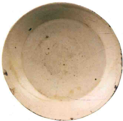
▲图 1-2 “胎釉均薄”定窑白瓷碟 宋代