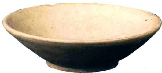
▲图 1-5 邢窑白瓷碗 唐代

虽然白瓷为人们生活当中的日常生活用具，但在漫长的岁月长河中，白瓷形成了特质鲜明的文化内涵，当然这种文化内涵本质内容的体现主要在其鼎盛时期，而且多限定在精致瓷器之上，如著名的邢窑精致白瓷就较为典型，其表现形式不仅造型隽永、雕刻凝炼、釉质润泽、手感光滑、如脂如玉，釉色洁白、纯正，釉层均匀，从外表上看，可谓是精美绝伦，但这并不是其真正的精神内涵（图 1-5），相信像华丽的外表，衰落期的明清白瓷也有，而当我们今天看到残缺的邢窑白瓷的胎体横界面时，不禁为之感叹！这才真正理解了大唐盛世之中邢窑白瓷的精神内涵，我们看到邢窑白瓷“胎体和外表一样的美”，具有选料精、淘洗精炼、细腻、洁白、均匀等特点，精致者胎体与釉同色，这可能是人世间最美的艺术品了，想必是在一种强大精神力量的支撑下完成的，这种精神就是追求“真、善、美”，