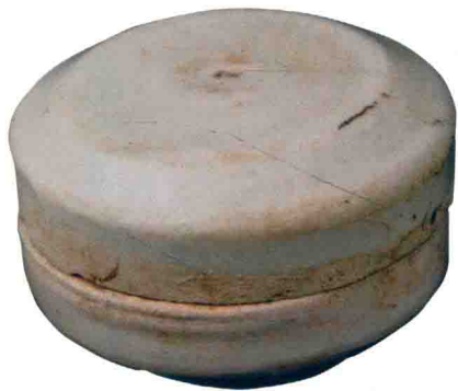
▲图 1-1 “类雪似玉”邢窑白瓷盒 唐代

白瓷时代特征较为明显，自隋代产生后，经过很短一段时间的酝酿，入唐后迅猛发展，渐至鼎盛，产生了著名的邢窑白瓷——“类雪似玉”（图 1-1），并以极低的价格“通销全国”，白瓷的普及达到了前所未有的高度，形成了“南青北白”的瓷业格局。五代时期的邢窑由于唐代衰落，已经失去物质文化支撑变得不堪重负，但在惯性力量之下，五代白瓷依然延续传统，基本上与唐代相似，直至北宋时期，一个新的窑场定窑在继承邢窑的基础上逐渐兴起，定窑对邢窑白瓷进行了改革，胎体变得轻薄，釉质进一步稀薄（图 1-2），这样的目的显然是为了烧造出更加廉价的产品，符合宋代封建社会走下坡路衰落的经济状况，但定窑神奇般地在烧造技术上进行了诸多革新，烧造出了几乎与唐代邢窑相媲美的白瓷产品，而且有效地降低了成本，使得白瓷再一次创造了辉煌。元代白瓷开始衰落，其窑风依然延续定窑低成本路线，在烧造质量上呈现出明显下