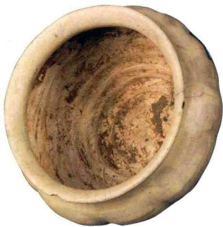
▲图 1-3 白瓷瓜棱罐 元代

降的趋势（图 1-3），这种质量上的下降是普遍的，然而这种烧造质量的下降显然并不是由于技术的失传，主要是观念上的问题，已经完全抛弃了唐宋时期将白瓷当成艺术品烧造的概念，而是坠入了红尘，只要能够使用就可以，开工艺粗糙化之先河。明清时期中国白瓷的烧造依然延续了元代，再加之青花瓷的冲击，基本上将白瓷排挤在主流市场之外，多数为人们生活的附属用具，或者是为很穷的人使用，在一些乡村窑场发现的明清时期的白瓷标本（图 1-4），非常的粗制，由此可见，至明清时期白瓷已经十分黯淡。但白瓷的生命力并未完结，直至今日白瓷依然还有烧造，窑火不熄。