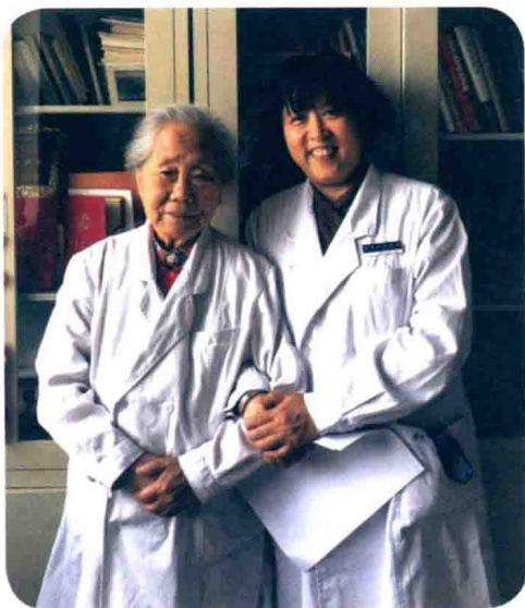
与顾复生教授合影

1965年6月26日，毛泽东提出要把“医疗卫生工作的重点放到农村去”。在这一指示的感召之下，部分大城市的医务人员下放到农村和基层，建立了比较完善的农村合作医疗体系，解决了广大农村和基层百姓的医疗就诊和预防免疫等困难，使人民群众的健康状况得以明显改善。