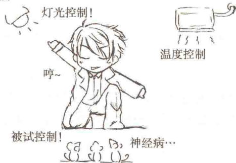
图 1-1 观察法和实验法