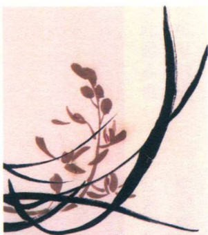
大寒 / 二候 / 兰花