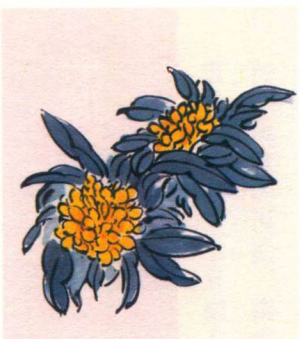
大寒 / 初候 / 瑞香