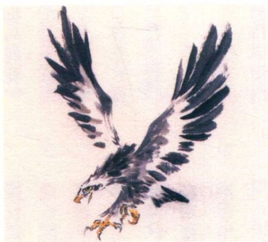
大寒 / 二候 / 征鸟厉疾