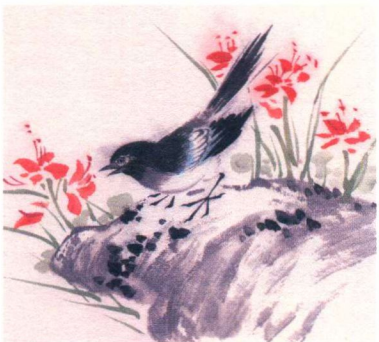
小寒 / 二候 / 鹊始巢