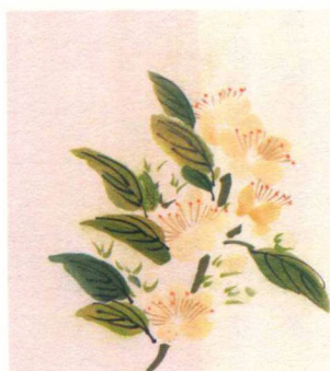
大寒 / 三候 / 山矾