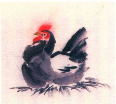
大寒 / 初候 / 鸡乳

⊙ 把芝麻秸和松柏枝扎制成一个佛龛，在供桌上摆上贡品和贡具。然后把剩余的松柏枝铺在门口，让路人在上面踩，发出咯吱咯吱的响声，这种响声会吓走鬼鬼祟祟的东西。这就叫做『踩祟』。