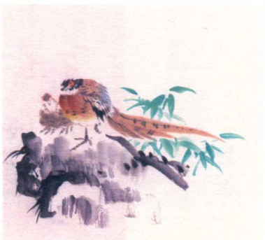
小寒 / 三候 / 雉始雊