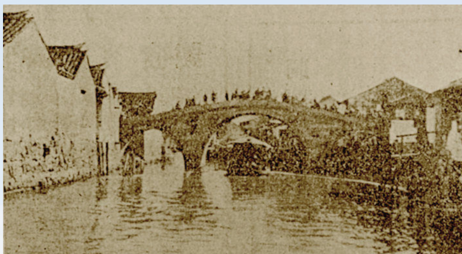
渡水桥 (20世纪 40年代)