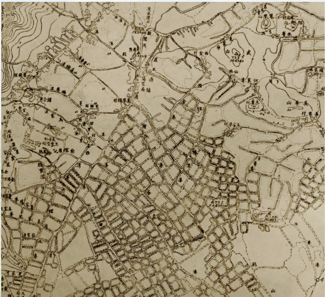
民国时期渡桥及周边河道详图