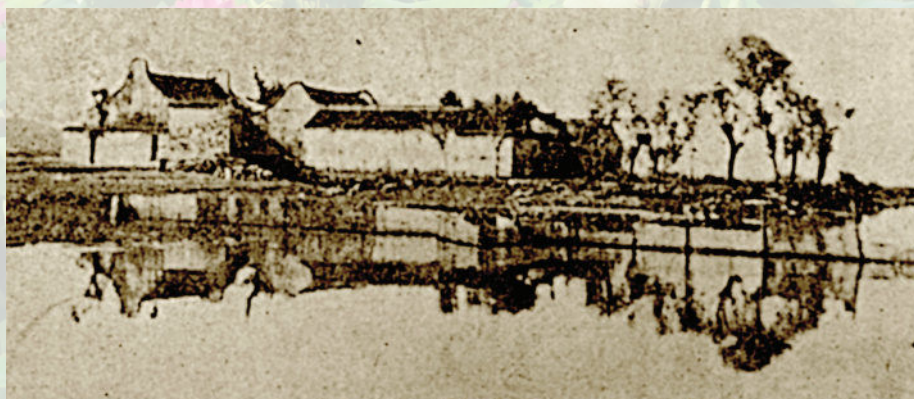
湖神庙 (20世纪 40年代)