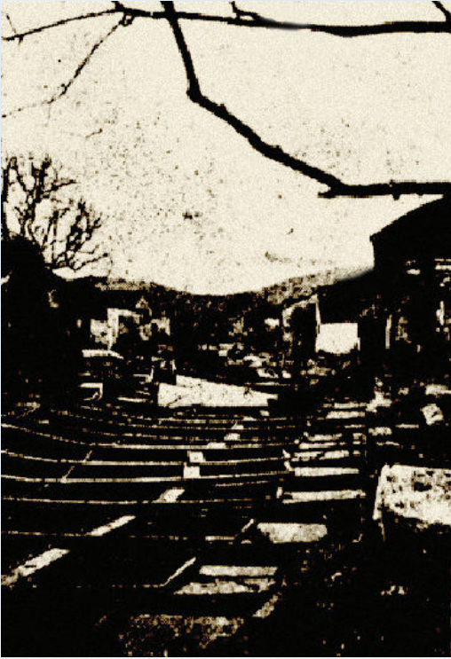
太湖渔船 (20 世纪 30 年代)