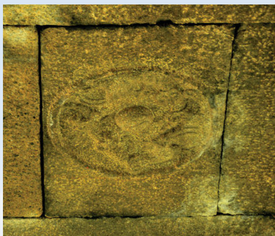
具区风月桥龙门石雕