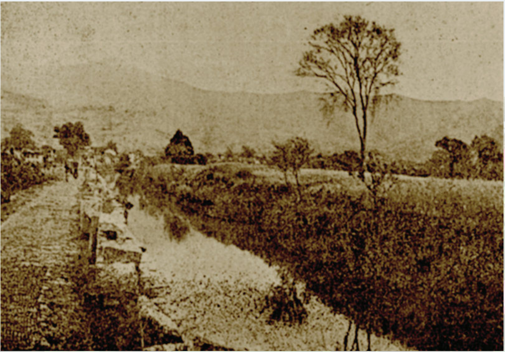
殿泾港 (20 世纪 40 年代)