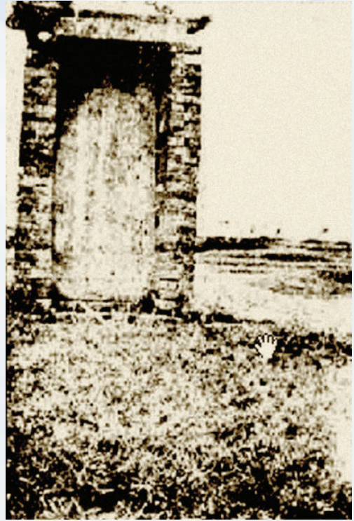
吴季子墓 (20 世纪 30 年代)