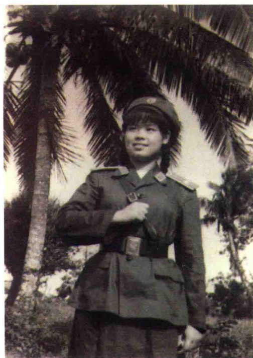
1957年,在海南军区文工团任舞蹈演员时留影。