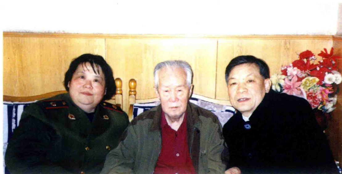
与词作家杨勇，原音协副主席、原解放军艺术学院院长、著名作曲家时乐濛先生合影。