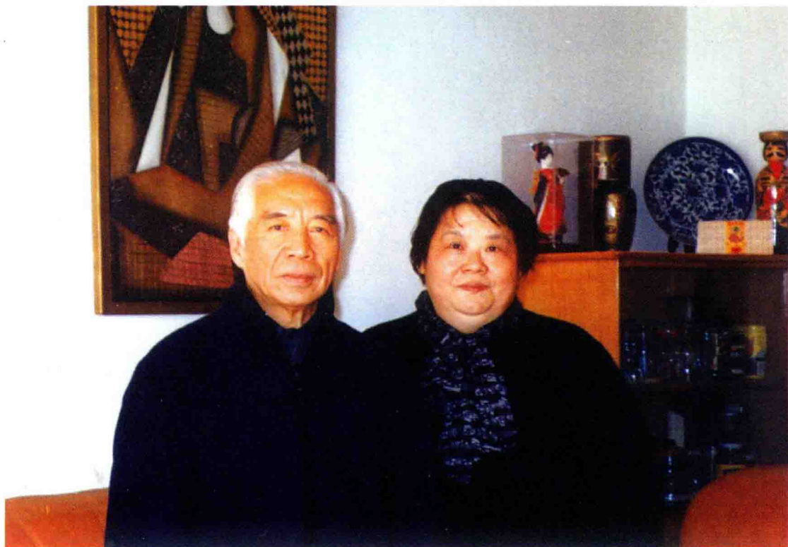
与音协名誉主席、中央音乐学院名誉院长、著名作曲家吴祖强先生合影。