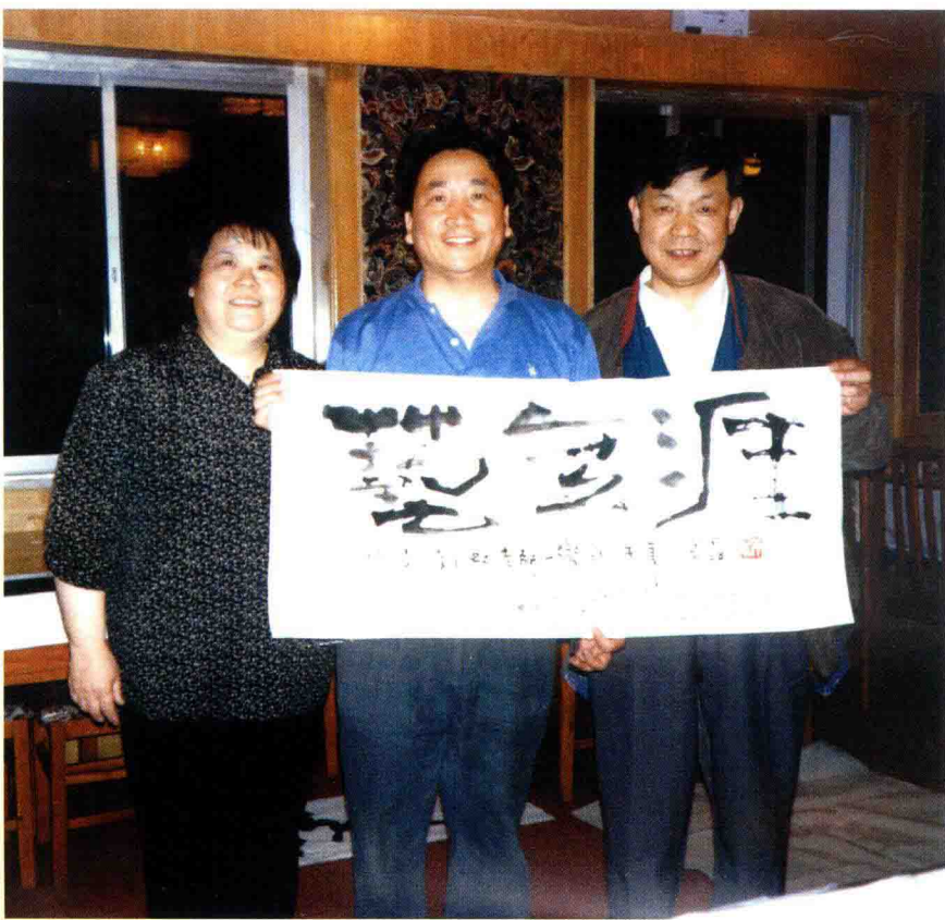
相声表演艺术家姜昆，为刘虹、杨勇题赠墨宝“艺无涯”。