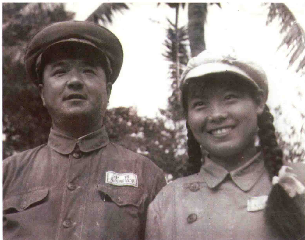
1955年与山东快书表演艺术家高元钧,在海南岛合影。