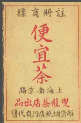
双龙茶叶广告火柴

华茶公司是近代中国华商最大的茶叶出口公司，1915年曾参赛美国巴拿马世博会并获奖。公司由粤商唐翘卿所创立，他是上海茶栈界举足轻重之人物。其子唐季珊曾留学英国，见识多广，极富商业手腕，1923年将华茶公司改组为有限公司，自任总经理，在唐氏父子努力经营下，很快就壮大成为中国重要的民族企业，唐季珊更因此博得“茶叶大王”。他是当时在东南亚特别著名的一位富商，由于他很有钱，许多电影公司都拉他入股，联华公司他就是一个大股东。