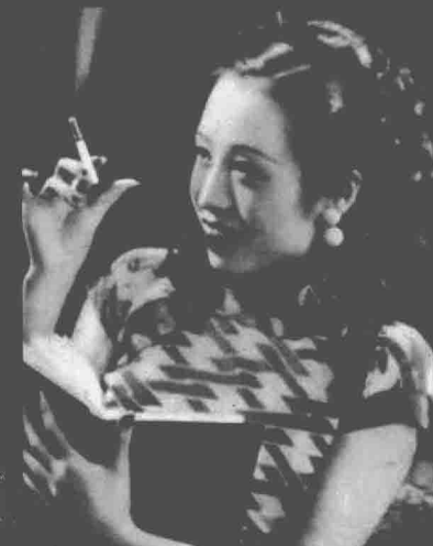
梁赛珍，广东人，1926年从影，主要成就主演《火烧红莲寺》，与同上银幕的胞妹梁赛珠、梁赛珊、梁赛瑚被称为“梁家四姐妹”。

涉足于美女如云电影圈的唐季珊，与张织云、阮玲玉、梁赛珍三位影星先后擦出情感“火花”，但都昙花一现，被他玩弄的这三位女性，最终结局都很惨：一个流落街头，一个自杀身亡，一个不知所踪。