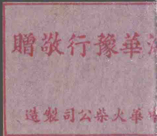
地球牌洋线团广告火柴 上海大中华火柴公司制造