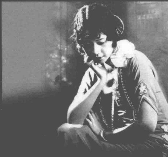
张织云（1904—1975），广东番禺（今广州）人，幼年移居上海，中国第一代女明星之一，第一位中国电影影后。