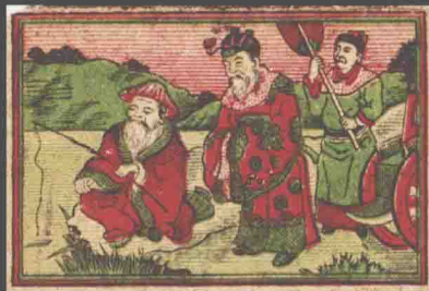
渭水牌火柴（横） 上海荧昌火柴公司出品