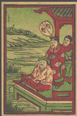
渭水牌火柴（竖） 上海燮昌火柴公司出品

1926年，燮昌衰败，被刘鸿生等人操控后，为了将燮昌品牌“渭水”商标占为已有，谎称燮昌资产重组后，择定白莲泾继续营业。为了利益之争告荧昌注册之第五十三号“渭水”商标为仿冒商标，请求商标局就此案件予以裁决。据1926年8月31日《商标公报》第七十八期“商标局评决书”，燮昌与荧昌就“渭水”商标（见附图，一纵一横彩色大贴）诉讼一案中，谓燮昌“渭水”商标创用于光绪十六年（1890年），“开始使用历经上海著易堂刷印”，指责上海荧昌厂创用于民国五年（1916年）的“渭水”商标系为仿制。最终仲裁：商标局认为燮昌“渭水”商标已委托鸿生公司