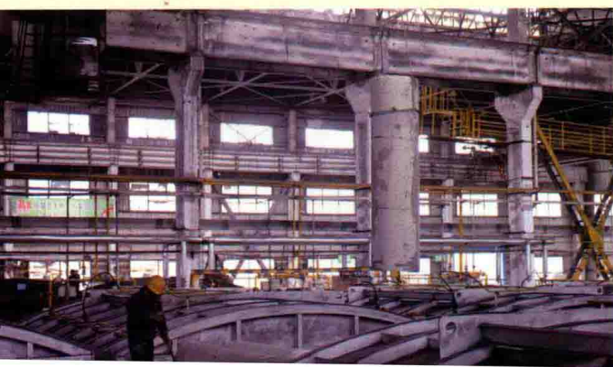
方大炭素工作车间。