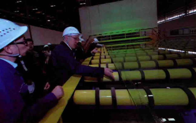
证券时报采访团参观福耀玻璃生产车间。