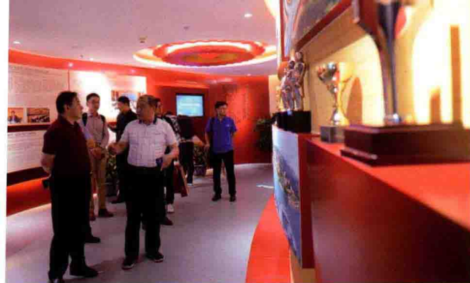
证券时报采访团参观中国中冶展厅。