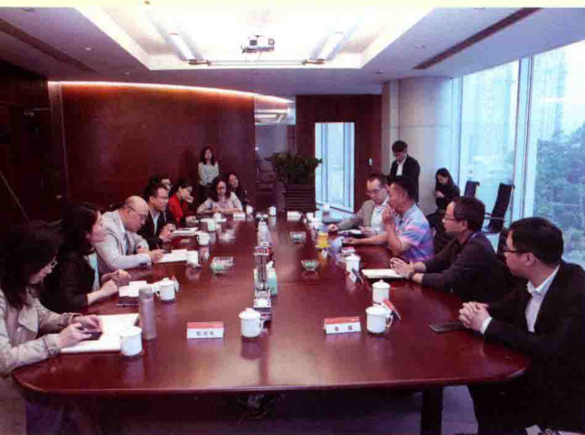
证券时报采访团采访中集集团现场。