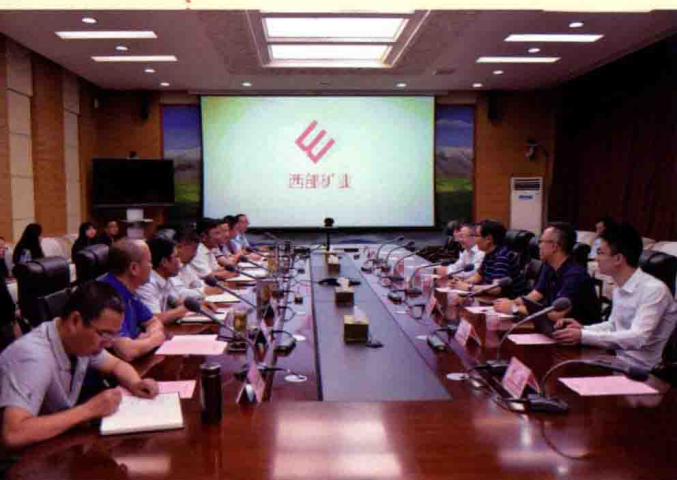
证券时报采访团采访西部矿业现场。