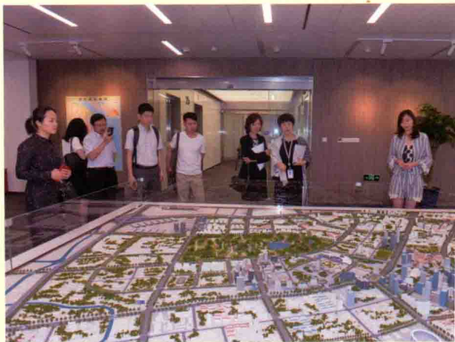
证券时报采访团在陆家嘴展示厅参观。