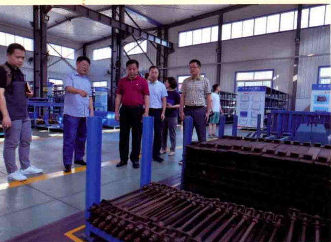
证券时报采访团参观兖州煤业。