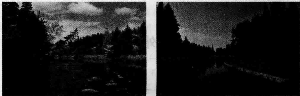
图 1-1 森林公园