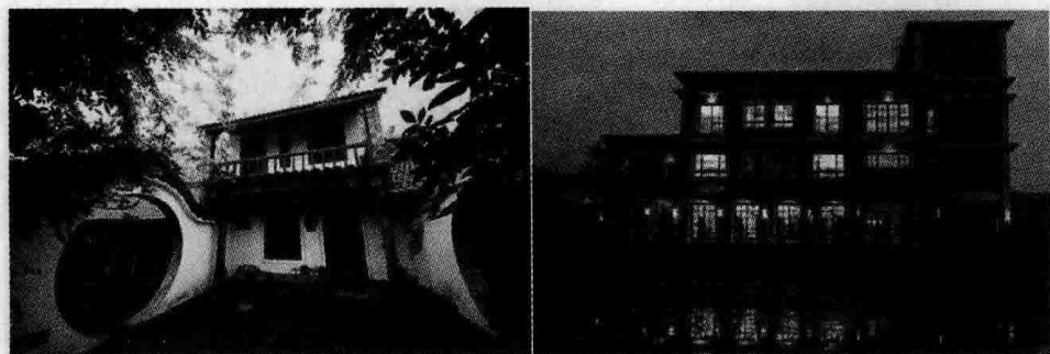
图 1-2 民宿农庄