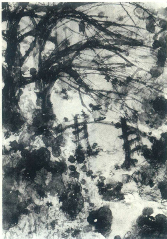
图5 散锋笔致 傅抱石作品局部

法用散锋，松灵而秀，尤贵其锋散而气不散也。更兼以渍墨狂点，气势雄伟，墨润浅深，笔简意密，反见精神，树影婆娑，虽然意在风势，实亦成就画中大势，则画面气机鼓荡，使观画人如闻其声，如接其光。