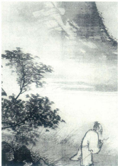
图2 浓淡墨相破法 陈玉圃《寺出飞鸟外》

所谓用笔，不仅指线条而已，凡画中点、线、块、面类所有笔触皆是用笔，亦皆是用墨，是以以笔运墨，以墨彰笔，笔与墨会，化一而成氤氲，绘事之能事毕矣。