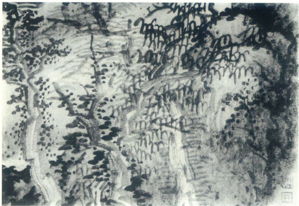
图7 清·龚贤作品局部