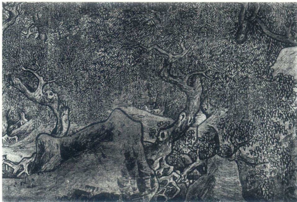
图8 宋·李唐《濠梁秋水图》局部