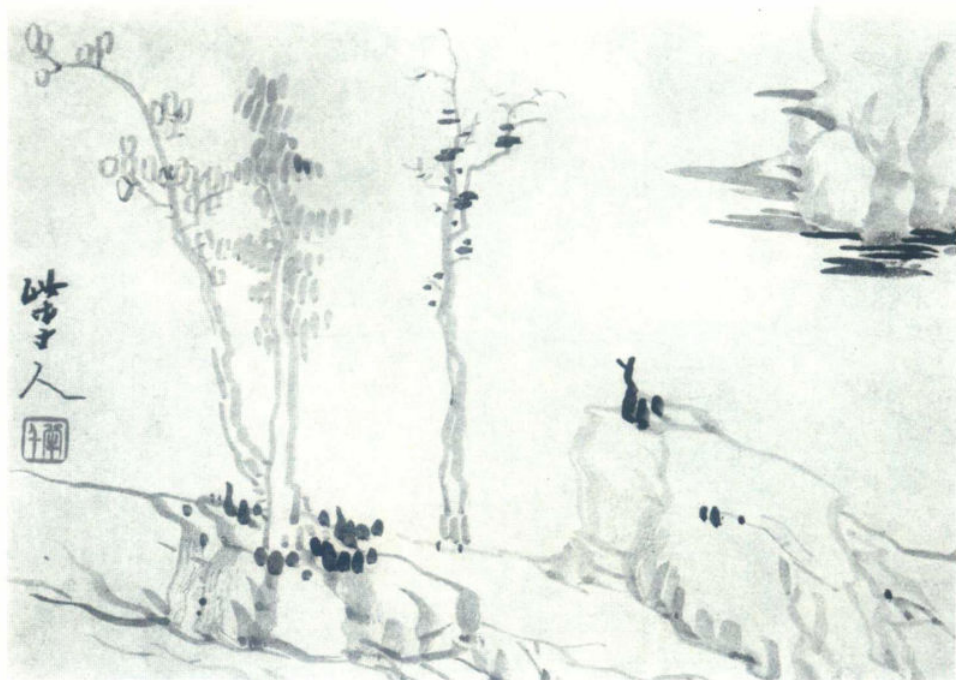
图9 清·龚贤《自藏山水册》