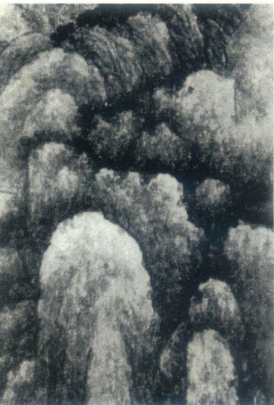
图4 积墨法 清·龚贤《溪山无尽图卷》局部