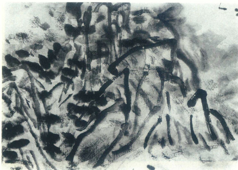
图6 折钗股笔致 黄宾虹《简笔山水》局部