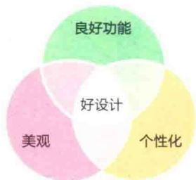
图1 好设计的三块拼图

虽然今天,关于何为好设计的讨论是复杂的,带有参与者强烈的个人情感,且受到每个时期纷繁复杂的社会因素影响而飘忽不定,难以一言概述。但我认为,今天的好设计至少包括三个方面最基础的考量,我将之喻为“三块拼图”(图1):