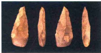
图4 现藏于法国图卢兹自然历史博物馆（MHNT）的欧洲阿舍利时代的手斧

而一旦加工能力稍有提升，人类对于形式美的追求便急不可耐地涌现，正如古希腊哲学家德谟克利特一针见血地指出：动物只求必需的东西，反之，人则要求超过这个。终于，以海