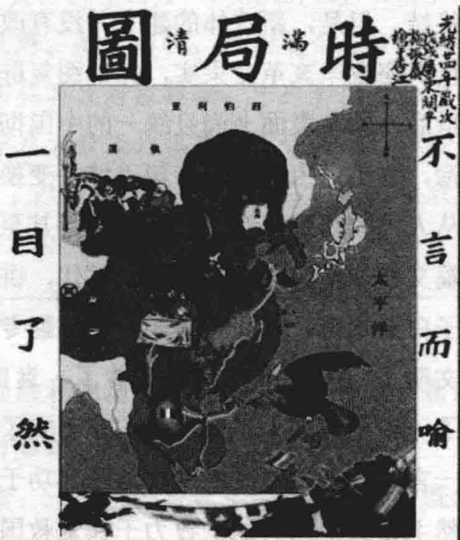
晚清时期，表征中国危机四伏的漫画

以英国为首的西方帝国主义国家，用坚船利炮打开了中国的大门，给这个沉睡的中国既带来了更有竞争力的现代文明，也带来了前所未有的灾难以及屈辱和痛苦。古老的中国逐步变成了半殖民地半封建国家，国家主权遭到严重破坏，人民生活陷入水深火热之中，中华民族面临着亡国灭种的危机。中国向何处去？这一问题成了近代中国仁人志士接力探求的核心问题；而实现民族独立、人民解放，国家富强、人民富裕就成为近代中国人民所面临的基本历史任务。