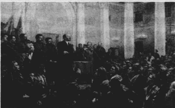
十月革命时，列宁在演说

在第一次世界大战爆发之前，腐朽、反动的俄国沙皇专制统治已经陷入深刻的危机。大战爆发后，俄国社会矛盾日益尖锐，革命形势迅趋成熟。1917年2月，俄