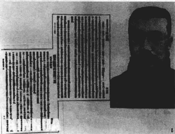
1918年10月，李大钊在《新青年》杂志上发表了《庶民的胜利》等文章

的被证明“管用”的经验，值得一试。二是十月革命不同于以往其他国家的革命，它代表了人类历史发展的方向。诚如中国的马克思主义先驱李大钊在1918年所指出的，十月革命是“立于社会主义上之革命”，是“世界人类全体的新曙光”。他甚至还预言，“试看将来的环球，必是赤旗的世界！”三是俄国十月革命的胜利展示工人阶级和劳苦大众的力量，找到了支持中国革命的力量所在。李大钊在《庶民的胜利》中就曾指出，“我老老实实讲一句话，这回战胜的，不是联合国的武力，是世界人类的新精神。不是那一国的军阀或资本家的政府，是全世界的庶民”。四是俄国十月革命以科学理论，也就是马克思主义为指导，不但摆脱了一切旧式的农民起义和资产阶级革命的局限性，并由此获得了一种历史的前瞻性眼光。