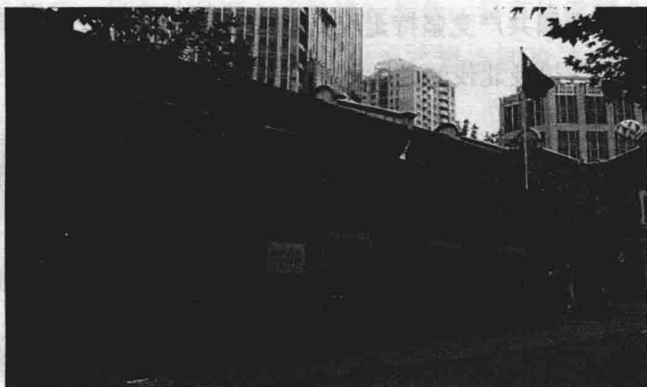
中国共产党一大会址

1921年7月，中国共产党第一次全国代表大会在上海召开。大会确定党的名称为“中国共产党”，党的纲领是“革命军队必须与无产阶级一起推翻资本家阶级的政权”，“承认无产阶级专政，直到阶级斗争结束”，“消灭资本家私有制”，以及联合第三国际。