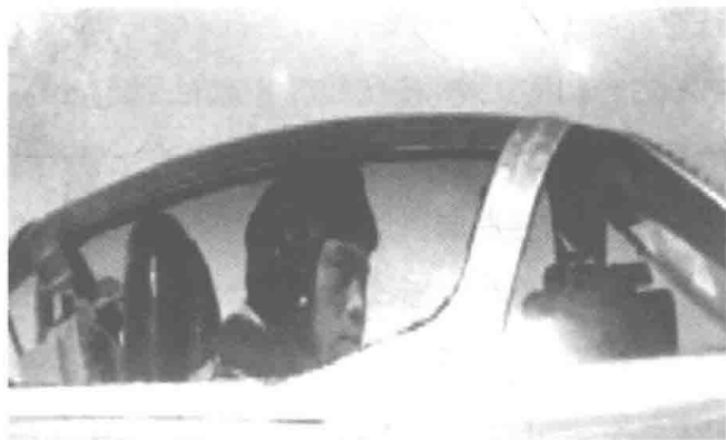
照片 1-4 志愿军空军第 4 师 10 团 28 大队大队长李汉驾驶米格-15 歼击机回到辽阳基地。李汉是第一位击落美国飞机的新中国飞行员