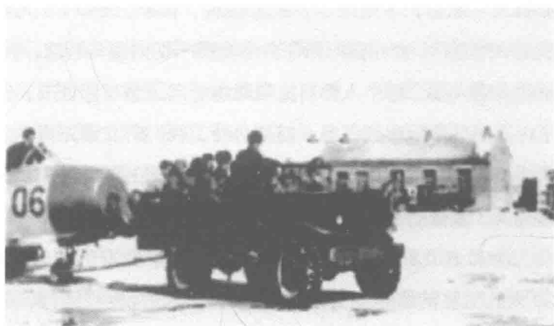
照片 1-2 空军 4 师 10 团 28 大队，空、地勤人员在辽阳机场练兵迎战。时值隆冬季节，大雪覆盖着北方大地，但练兵依然热火朝天进行