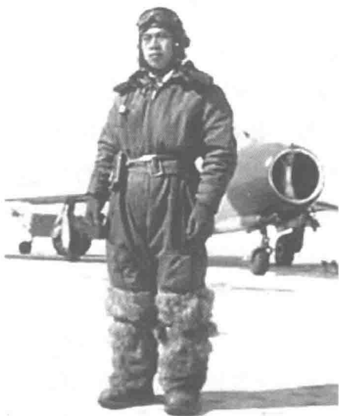
照片 1-5 李汉击落敌机之后回到辽阳基地休整，准备再上前线。此为李汉的戎装照片