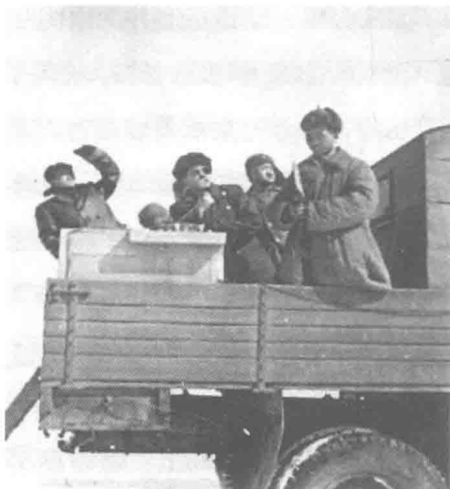
照片 1-1 志愿军空军第 4 师副师长袁彬（中），在机动指挥车上指导战机演练空战。袁彬不久后调任空军第 3 师师长