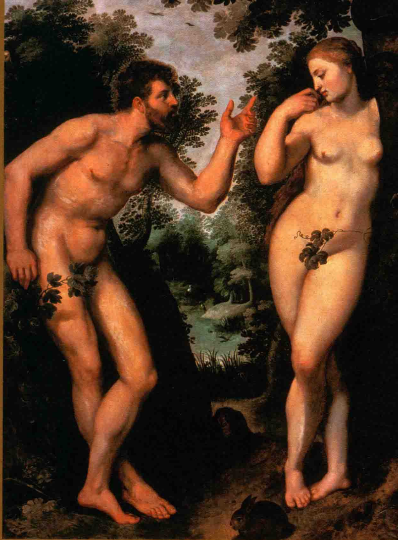
彼得·保罗·鲁本斯 (Peter Paul Rubens) 的画作《亚当和夏娃》