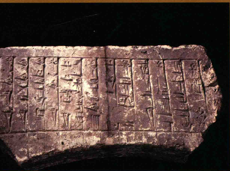
公元前 2500 年的苏美尔石碑，出土自伊拉克的考古遗址拉格什