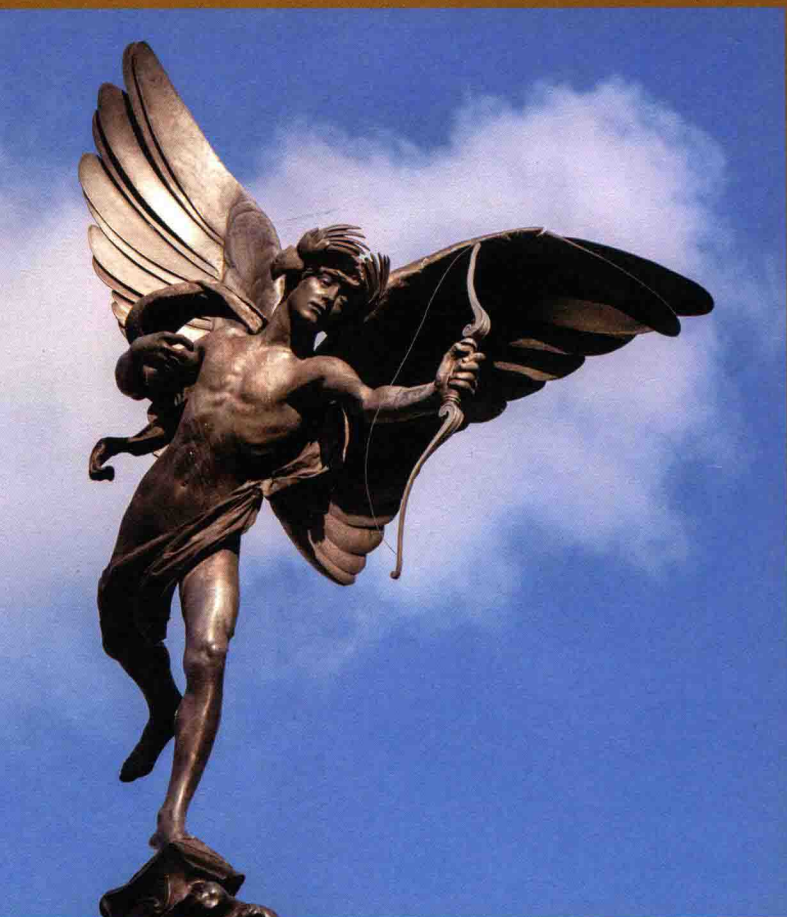
英国伦敦的皮卡迪利广场的厄洛斯（Eros）雕像