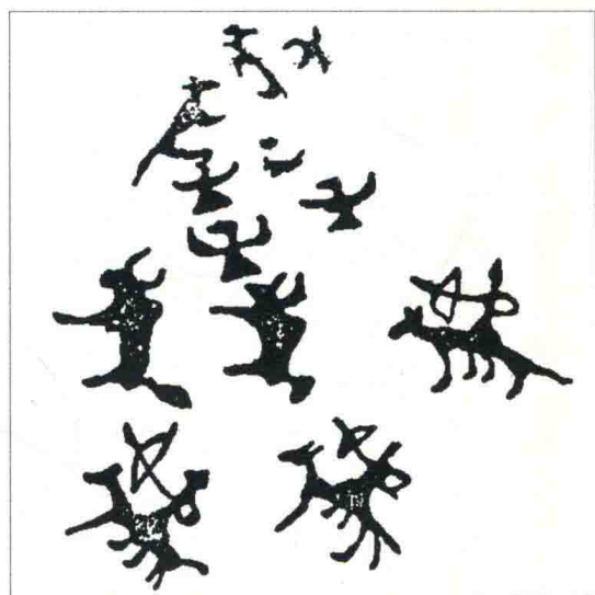
图4-2-2 骑者狩猎，鲁日朗卡岩画

岩画描绘的是高原上狩猎与畜牧的生活。西部岩画从动物种属上看，均为现生种，凿刻有羊、牦牛和鹿等动物。图像中除动物外，还有持矛或弓箭的人物，猎人有步行的，也有骑马的。有一幅岩画人物刻在羊的右侧，张开双臂，两腿分立，似在驱赶羊群。画幅下部有一头牦牛，牛的下面是两个人在舞蹈，其中一人着长袍，左臂下垂，右手平伸，其左侧也刻有一动物。这组岩画，上部的图像采取单线刻制的方法，下部的图像轮廓内通体敲凿以形成剪影状。作品似在表现畜牧生活。