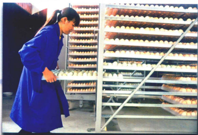
»化作土鸡孵化场