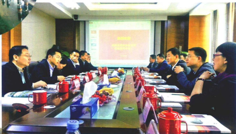
»县长许晓鹏到深圳市宝安区对接工作 资料图