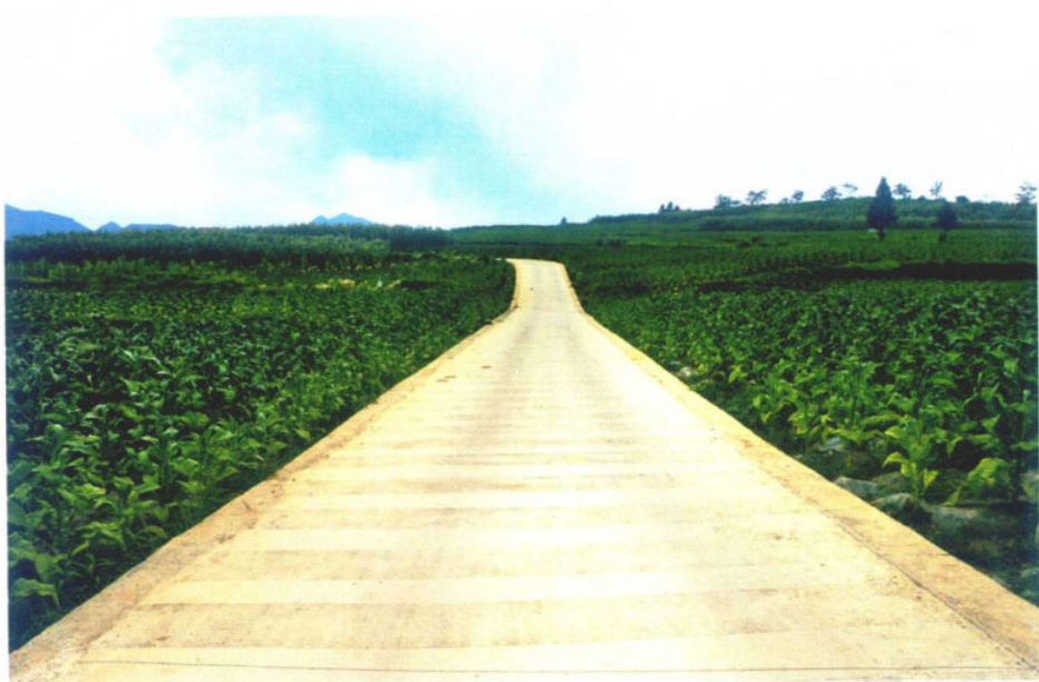
»村组公路

提高通讯质量。大力实施多彩贵州“广电云”村村通，提高数字电视网络覆盖率，推进4G网络建设、光网城市、宽带普及等重点工程。