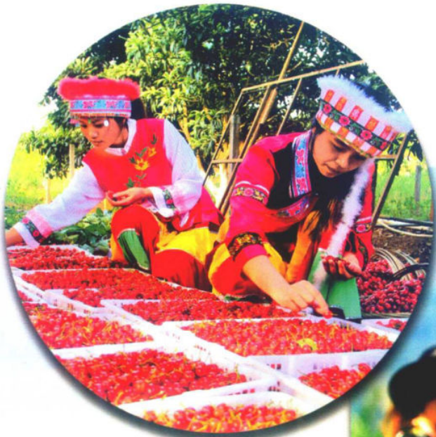
»“玛瑙红”樱桃