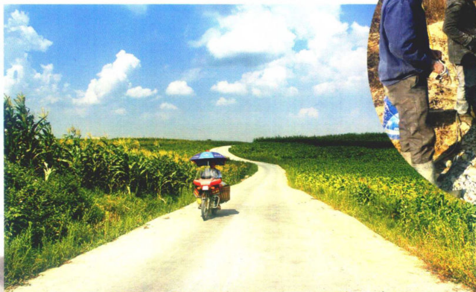
组组通道路建设如火如荼<<