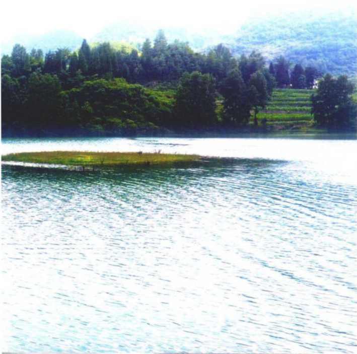
»绿如碧玉的红旗水库