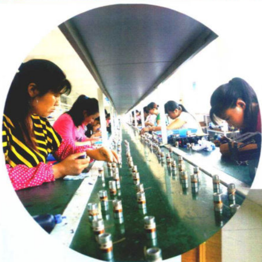
»纳雍县工业园区生产线