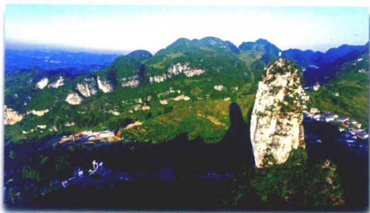
»枪杆岩下的美丽乡村