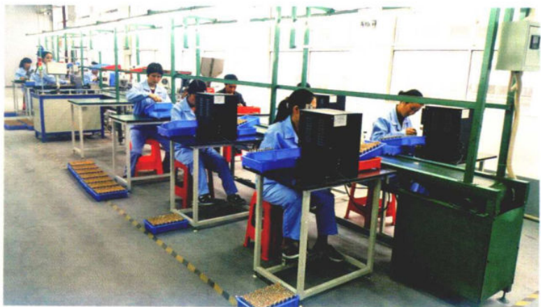
»纳雍经济开发区大拓新能源公司生产车间