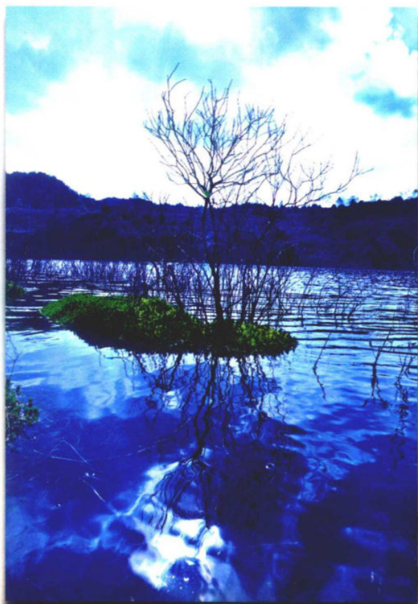
»水天一色的大坪管湿地