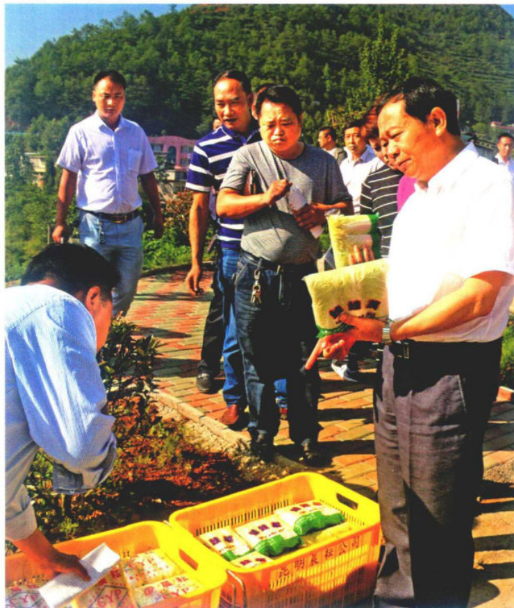
»县委书记彭华昌调研高山娃娃菜种植基地 资料图

打造文化旅游产业。加大旅游基础设施建设资金投入力度，大力开发九洞天周边区域、大坪箐、总溪河、金蟾大山等优质独特的自然资源，促进大众旅游向中高端体验式旅游发展，推动户外拓展、康养养生等体验式旅游与农业观光、乡村农家乐等大众旅游井喷式发展，将丰富的自然资源转化为经济优势。