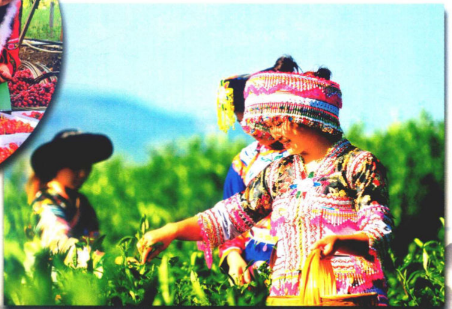
»茶山阿妹采茶忙