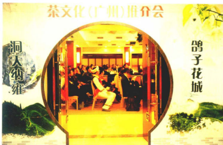
»纳雍县到广州推介纳雍农特产品