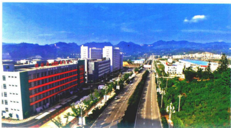
»航拍纳雍县工业园区

全力推进项目。加强对引进项目的跟踪协调，整合力量做好项目服务，完成高速公路、铁路等重大项目建设工作，有效推动投资稳步增长。