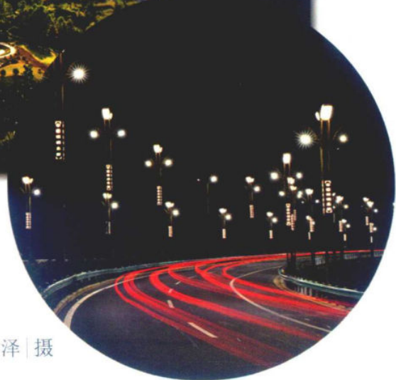
>>珙桐大道夜景