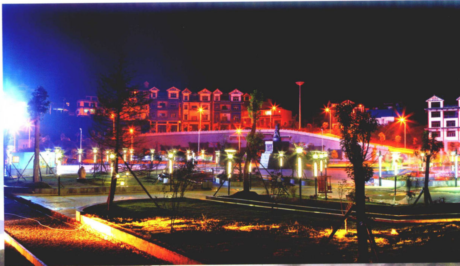
>>中国穿青人第一乡——勺窝特色小镇夜景