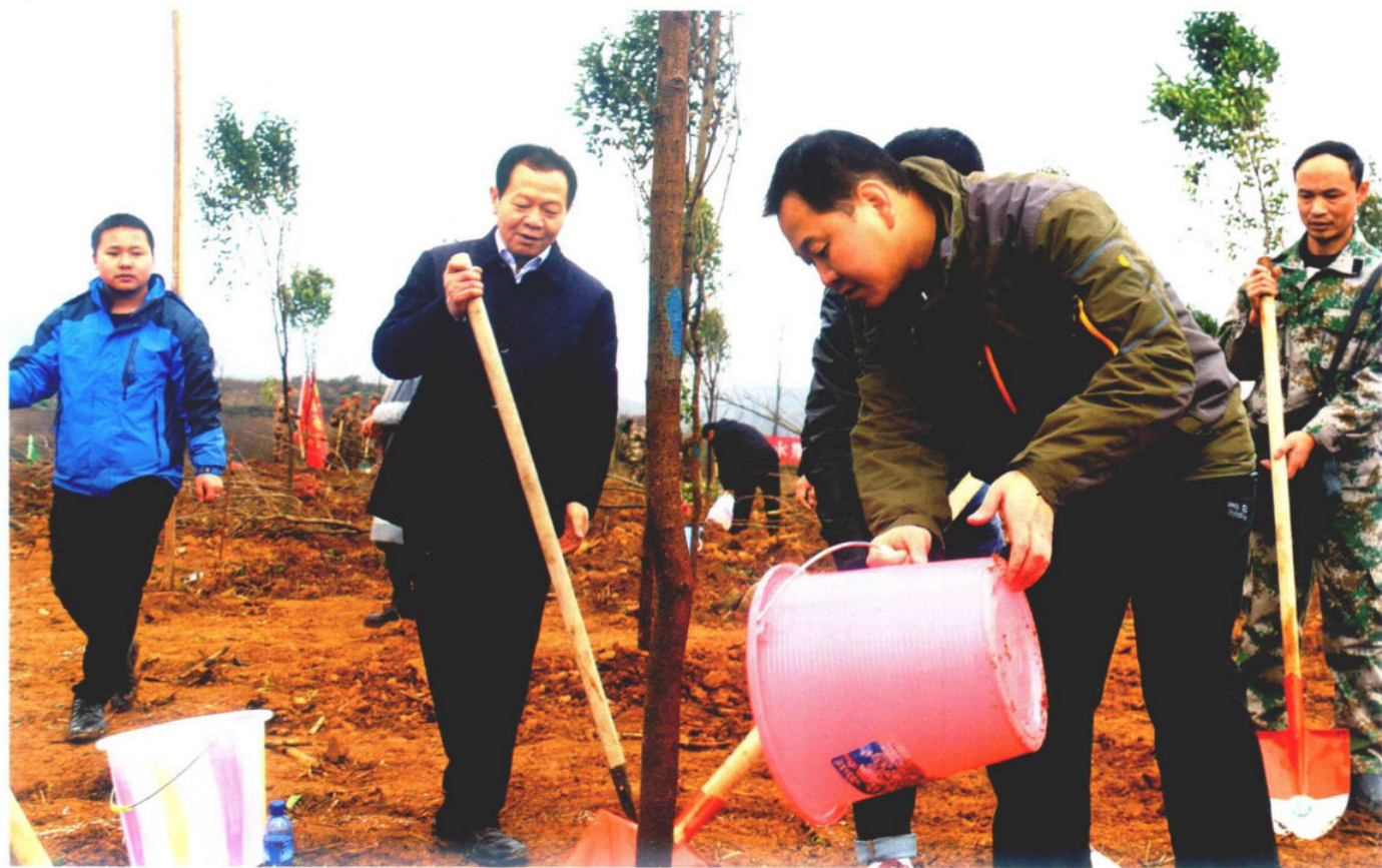
»绿化纳雍行动中的领导身影