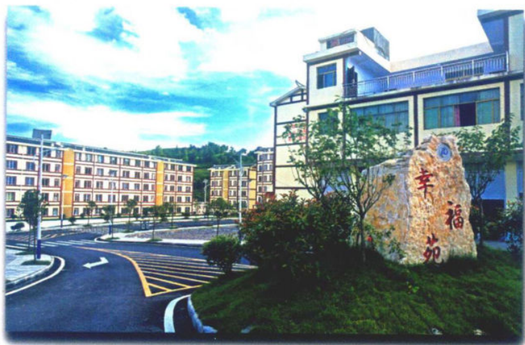
»玉龙坝易地扶贫搬迁点——幸福苑

夯实基础设施。全力补齐贫困乡村水利、交通、电力通讯、教育卫生、安全住房等基础设施短板，改善群众生产生活条件。