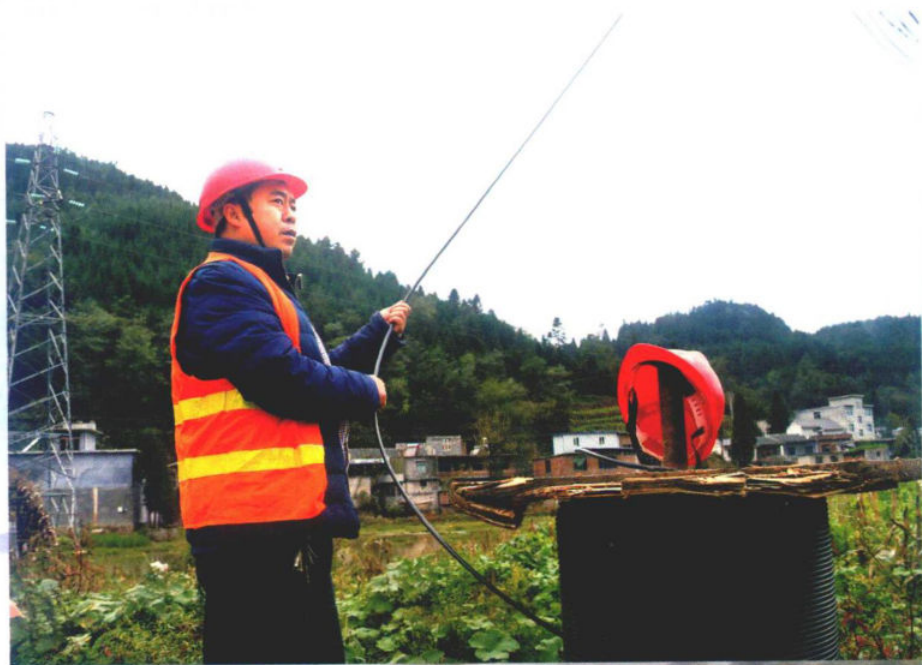
»“广电云”村村通施工现场