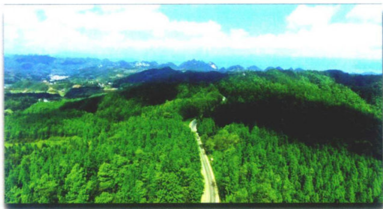
»纳雍县化作林场

建设绿色家园。以棚户区改造为突破，加快宜居宜业山水城市建设，推进特色绿色小城镇建设，谋划打造一批规模适度、富有特色的生态建设示范点，因地制宜建设好生态湿地公园、自然水体和特色村落。