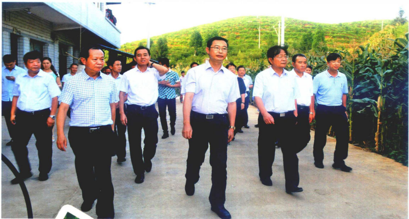
>>广州市市长温国辉到纳雍调研 资料图