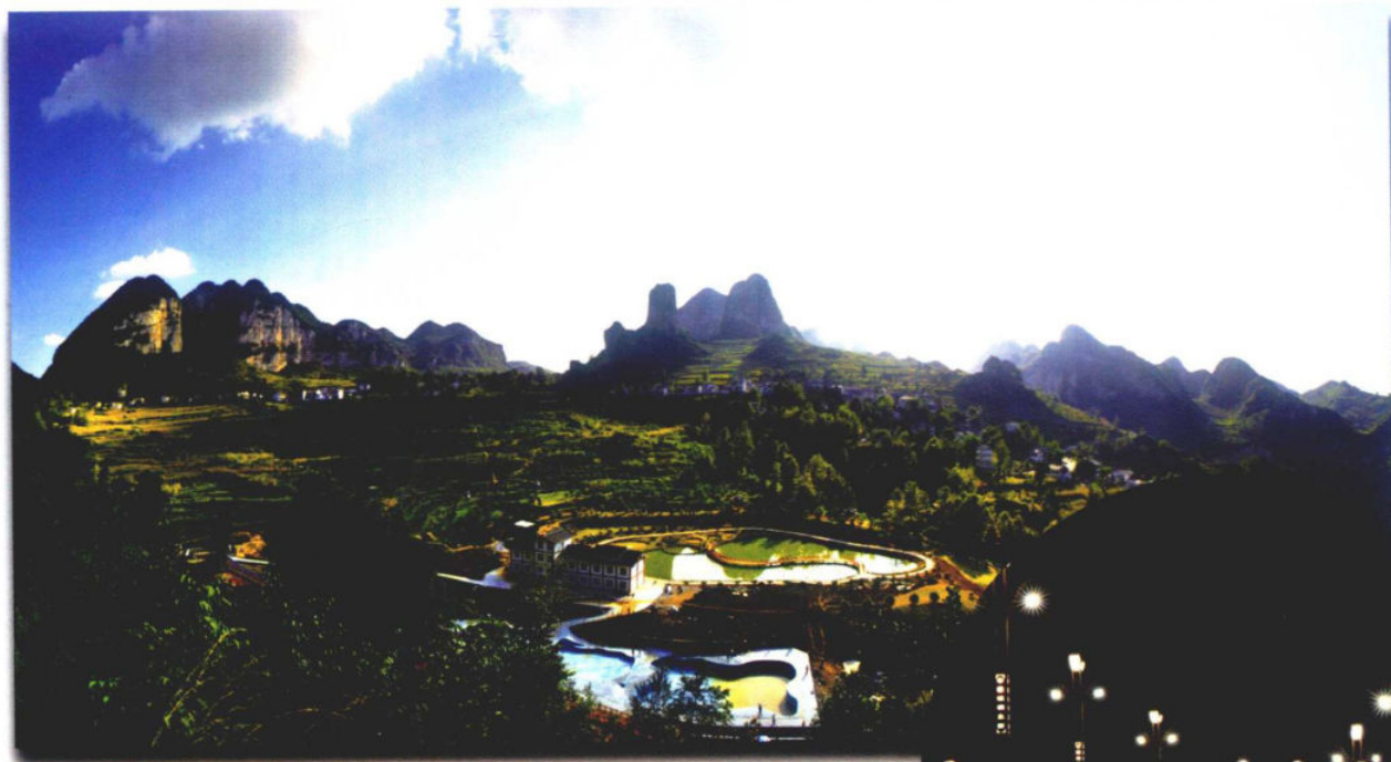
>>枪杆岩新貌