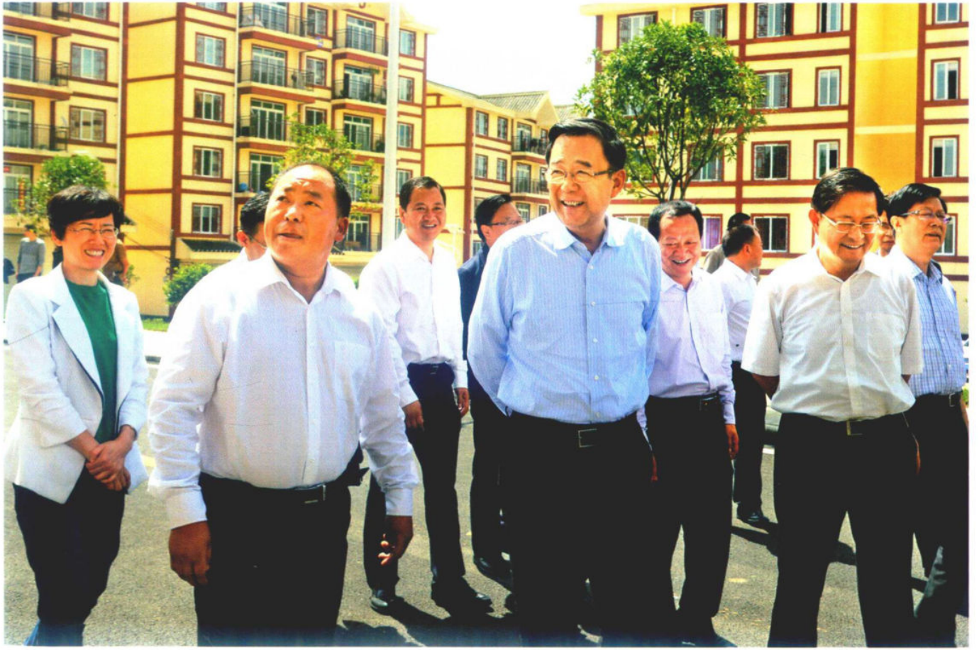
»孙志刚在玉龙坝镇易地扶贫搬迁示范点考察