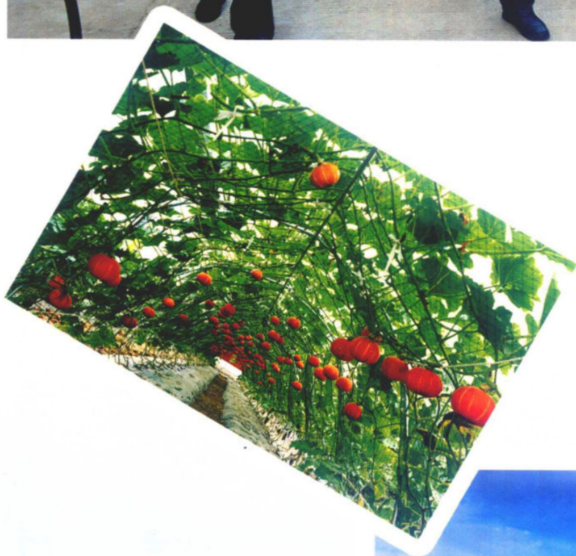
>>现代农业园区瓜果飘香