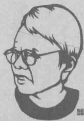
国家图书馆培训部原剪纸老师