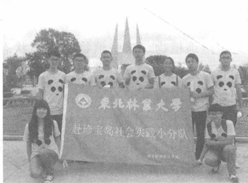
图 1-1 全体营员抵达珍宝岛自然保护区

此次活动精心准备了 200 份调查问卷, 内容涉及生态环境建设、自然保护区管理常识、野生动物保护观、宣传教育途径和基于 AHP 法的大学生社会实践活动评价等多个方面。本次问卷调查活动, 环境保护调查主要针对