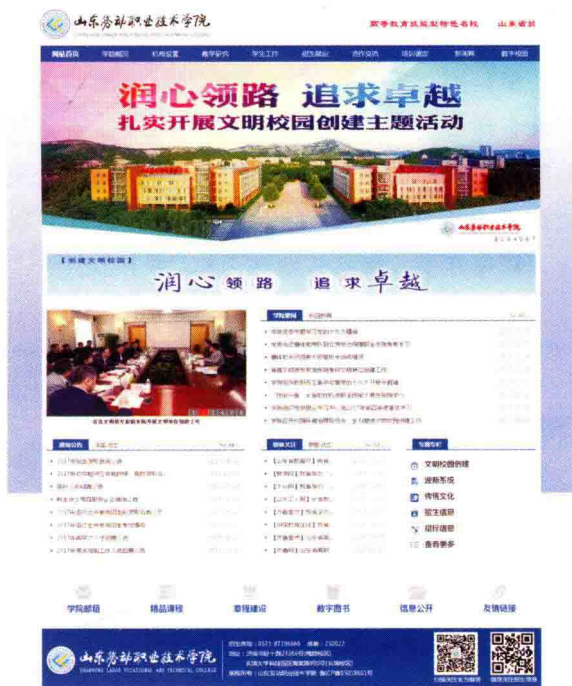
图 1-1 学院网站首页