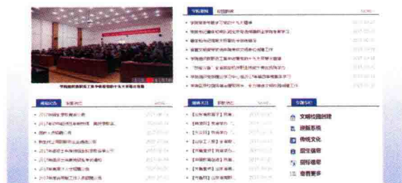
图 1-13 网站内容栏

网站内容栏：首页设置的栏目科学合理、条理清晰，突出信息的时效性(图 1-13)。