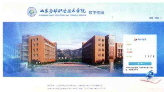
图 1-10 数字校园动态网页登录界面

专题页面链接：专题页面是对专一产品或活动的内容集中收集主题页面。主题鲜明，目的明确，时效性强，更新快。可单独进行推广，可在短的时期内聚集起用户群。比如山东劳动职业技术学院开展创建文明校园专题网页，体现学院的重要信息传递和学习功能(图 1-11)。