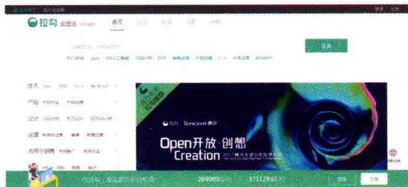
图 1-5 拉勾网网站首屏

网站特点：注重用户体验、搜索和导航功能强大。版面布局简单明了，方便操作。主色是绿色，平和、简约、充满生机。