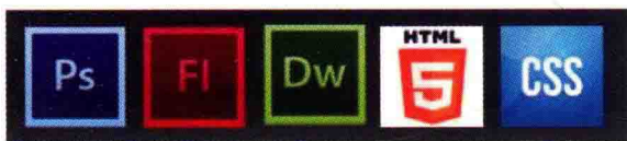
图 1-3 常用软件和技术图标