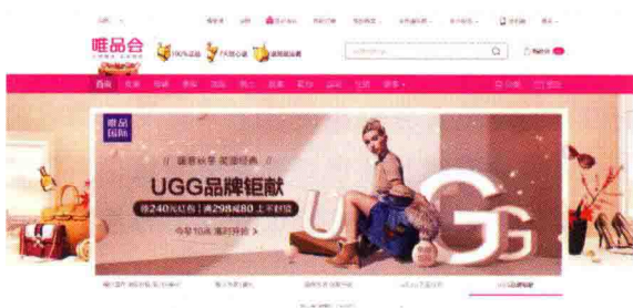
图 1-17 唯品会首屏中的页头、主导航