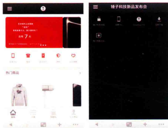
图 1-7 锤子科技移动端首屏和导航设计

网站特点：产品定位突出，整体风格体现艺术感、科技感和时代感。版面布局简洁、清晰，突出企业主推产品和活动。颜色是黑色和红色，营造大气、稳重和科技的品牌气质。