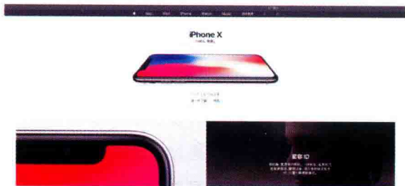
图 1-22 苹果官网首页

例如苹果官网首页(图 1-22), 主题展示新品, 鼠标移动到每个分块图片浏览新品的功能。点击图片可以看到对应的详细信息。这种交互设计直接简单, 实现快速浏览。从视觉设计上风格大气简约。版面用图片将屏幕分块, 营造清晰直观的视觉。