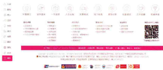
图 1-21 唯品会的页尾区

(5) 页尾：电商的页尾主要由承诺、服务保障和版权信息等部分组成(图 1-21)。