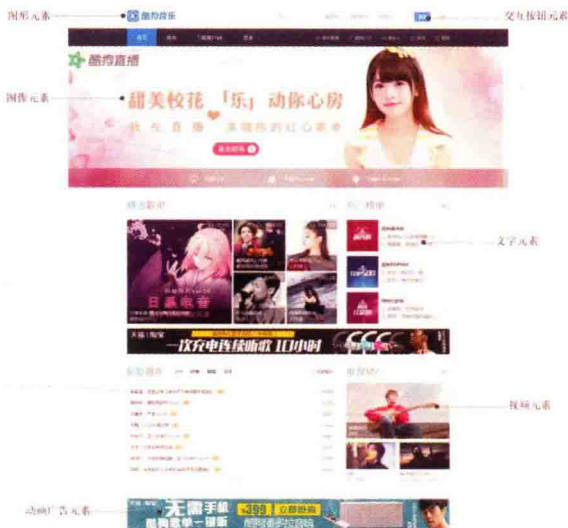
图 1-16 酷狗音乐首页

一个网站的页面交互性对于用户的重要性是不言而喻的。在一个网站中，网页上的常用交互元素包括页面上的按钮、超级链接、表单等。