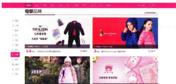
图 1-20 栏目区域

(4) 栏目区域：唯品会的栏目区域是商品展示区，模仿商场的楼层设计(图 1-20)。