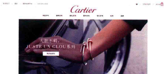
图 1-24 卡地亚官网

例如卡地亚奢侈品牌网站(图 1-24), 简约的设计使浏览者聚焦在内容上来, 图片内容的展示通过分割线起到很好视觉引导效果, 内容跟形式达到很好的统一。这种分割图片的设计方式, 在高端品牌网站中很流行。