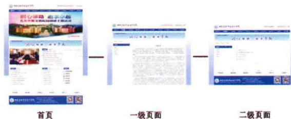
图 1-8 网站结构示意图

网站由首页、一级页面和二级页面组成(图 1-8)，包括静态网页和动态网页(图 1-9、图 1-10)。