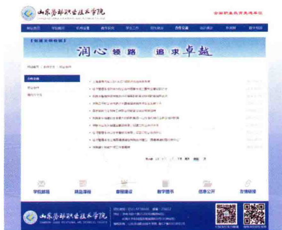
图 1-9 静态网页