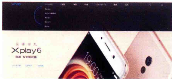
图 1-23 VIVO 官网

例如 VIVO 官网(图 1-23)主导航栏中。鼠标滑过出现该商品系列的不同产品。