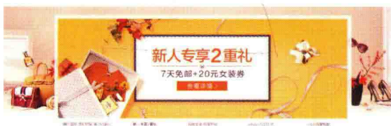
图 1-19 条幅广告

(3) 条幅广告(Banner)：电商中的条幅广告在主导航的下方(图 1-19)。首屏一般通过 Banner 将推荐和活动展示出来。