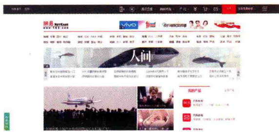
图 1-4 网易网站首屏

网站特点：页面信息量大、重要信息放在头部。内容以文字图片为主，版式以分栏为主，布局紧凑。颜色稳重大气。