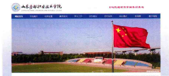
图 1-12 网站条幅

网站条幅：包括七个条幅照片轮播广告，展示学院风采。这是学院网站的第一屏，视觉的焦点以条幅照片为主(图 1-12)。