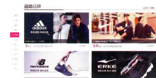
图 1-18 唯品会侧栏

(3) 条幅广告(Banner)：电商中的条幅广告在主导航的下方(图 1-19)。首屏一般通过 Banner 将推荐和活动展示出来。