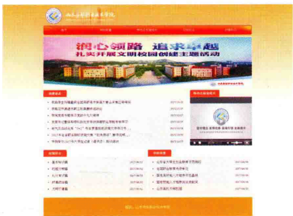
图 1-11 学院专题网页