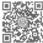
厦门大学出版社 微博二维码