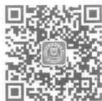
厦门大学出版社 微信二维码